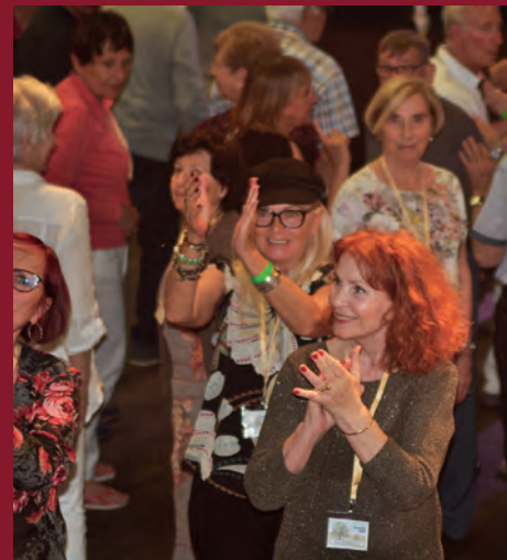
Sous les airs entraînants de l'orchestre, le