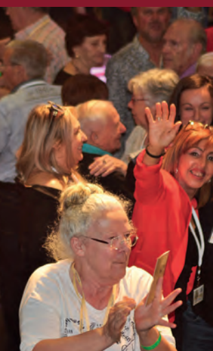
es saïdéens ont encore de l'énergie !