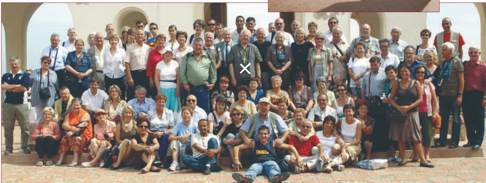
Tous réunis autour de Monseigneur Georges (au centre (croix blanche)) après la messe dans la Basilique