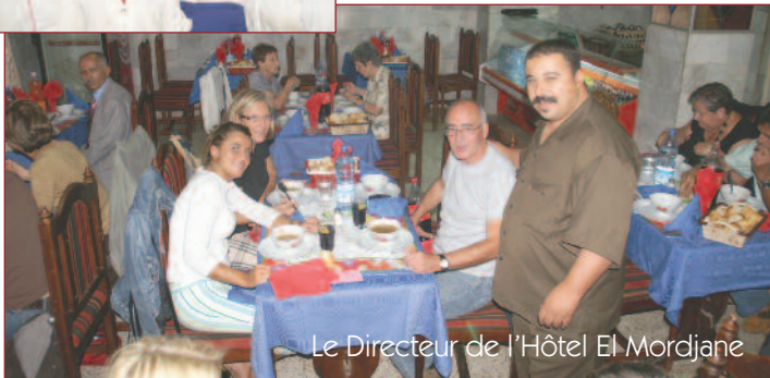
Le Directeur de l'Hôtel El Mordjane

pour nous. • L'Hôtel Shéradon (5*luxé) à Oran pour la qualité de son accueil et de ses prestations hors du commun.