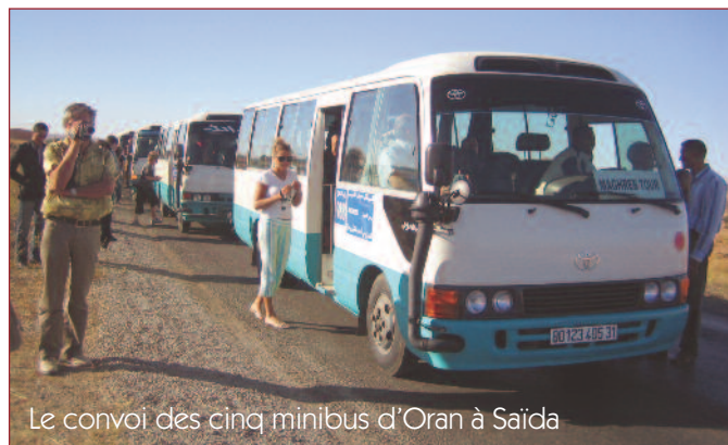
Le convoi des cinq minibus d'Oran à Saïda