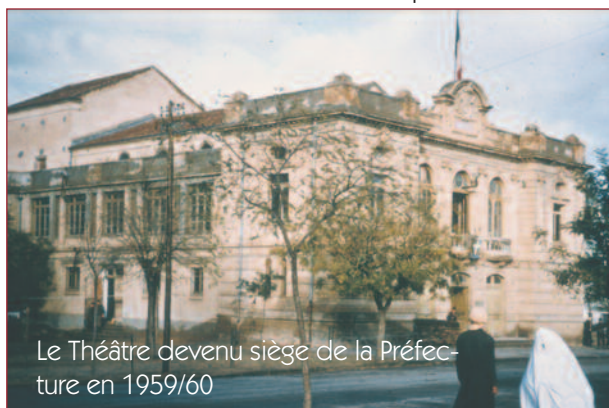
Le Théâtre devenu siège de la Préfecture en 1959/60