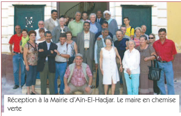
Réception à la Mairie d'Aïn-El-Hadjar. Le maire en chemise verte