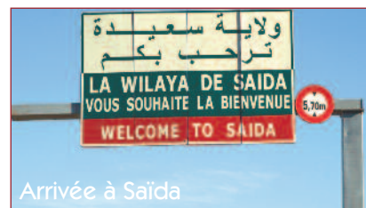
Arrivée à Saïda