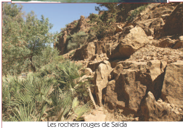
Les rochers rouges de Saïda