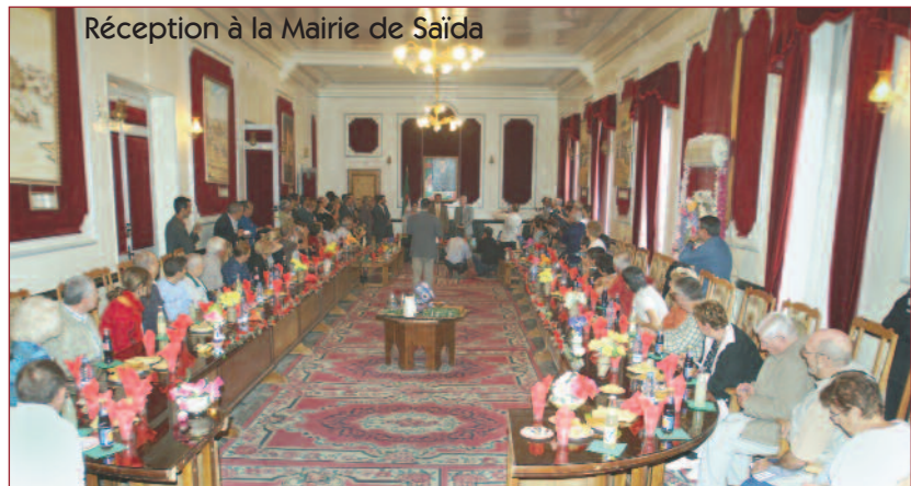
Réception à la Mairie de Saïda