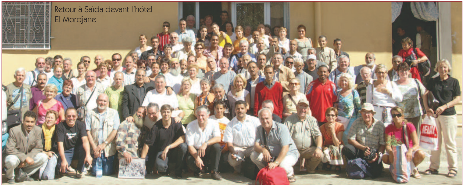
Retour à Saïda devant l'hôtel El Mordjane