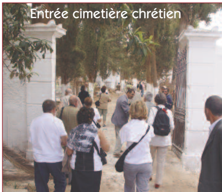
Entrée cimetière chrétien