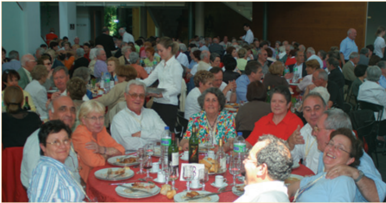
Premier rassemblement pour Françou avec ses proches

“Le repas du dimanche midi” est partagé par plus de 500 personnes sur la Place, un espace magnifique et lumineux au cœur de Diagora.