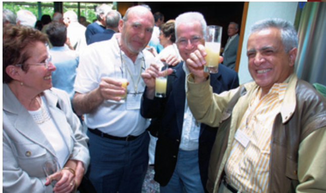
Ça trinque sec, même au pastis