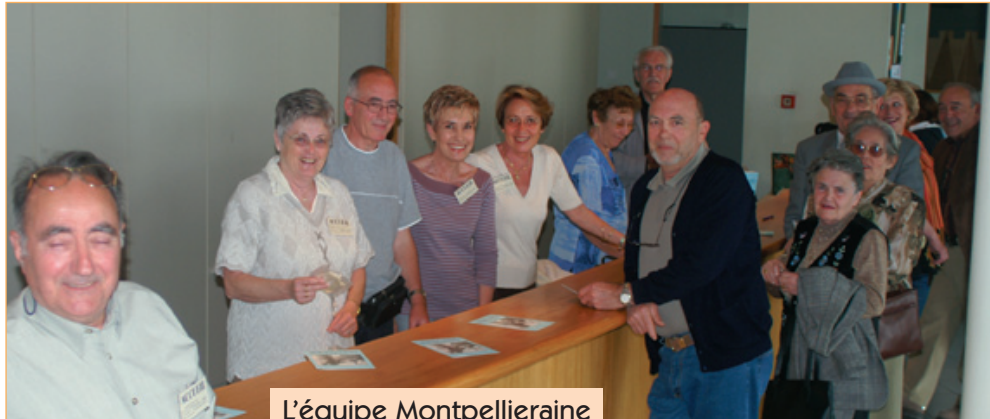
L'équipe Montpelliéraine à l'accueil

Bien sûr, les années, inexorablement, éclaircissent nos rangs, mais le bonheur de nous retrouver défie le temps. La météo nous avait prédit un temps pluvieux, maussade, mais le ciel, une fois de plus, nous a été favorable et a rendu les retrouvailles encore plus joyeuses.