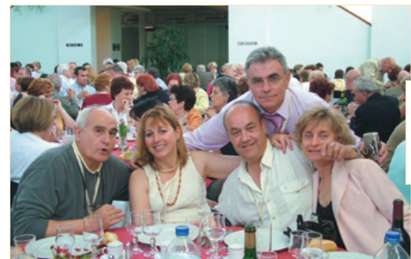
Des tables de mi-jeunes