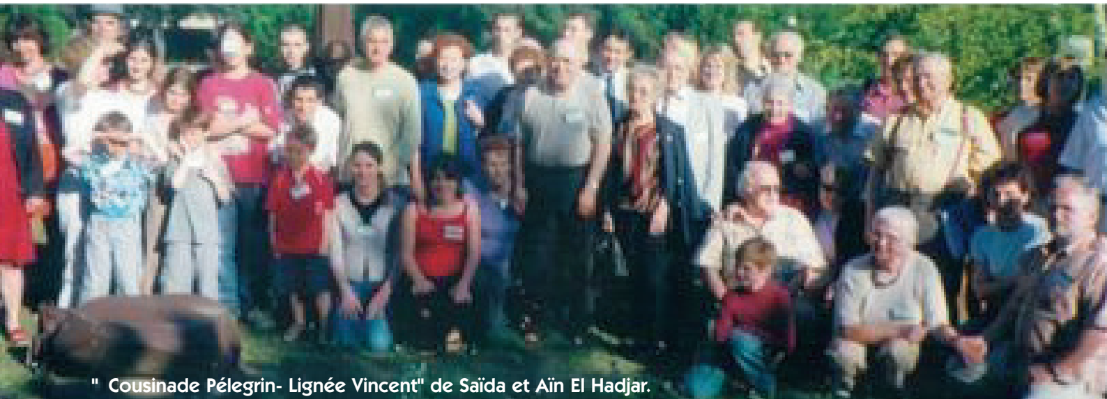
" Cousinade Pélegrin- Lignée Vincent" de Saïda et Aïn El Hadjar.