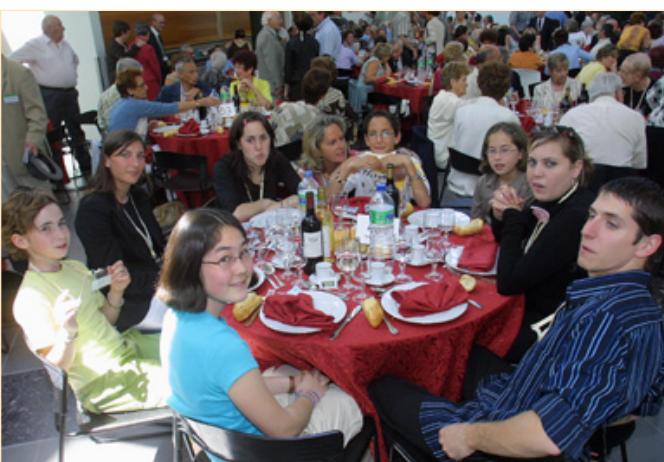
Une table de jeunes Saïdéens