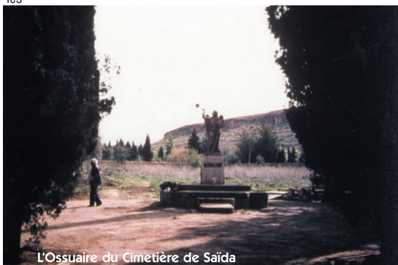
L'Ossuaire du Cimetière de Saïda

Par ailleurs, une information a été largement diffusée par les soins de la Mission Interministérielle aux Rapatriés en direction des associations de rapatriés d'Algérie, afin qu'elles puissent la communiquer aux familles concernées.