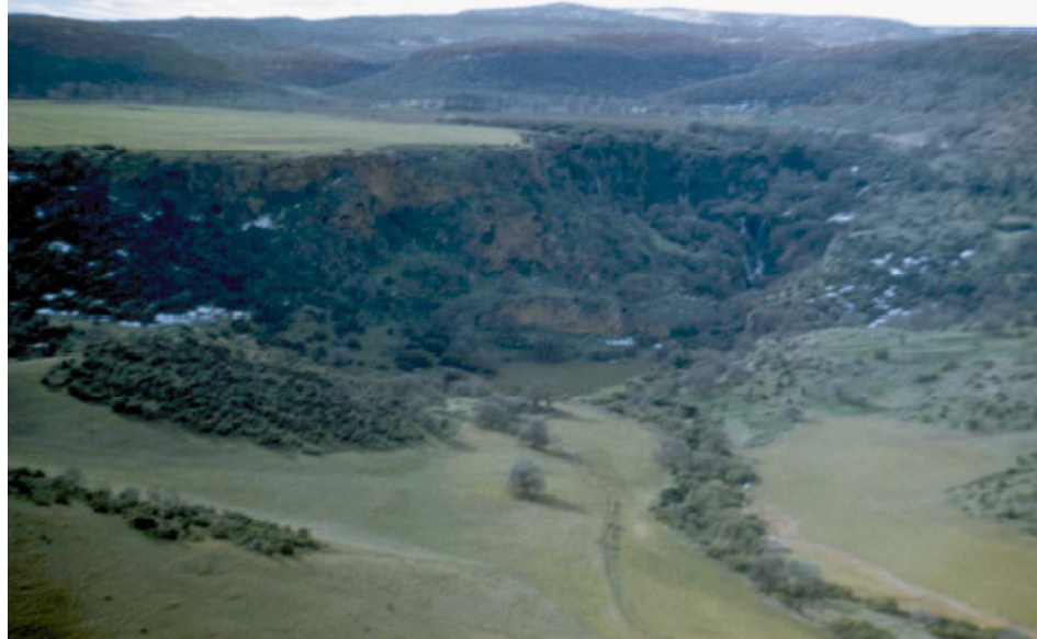
Monts de Daïa