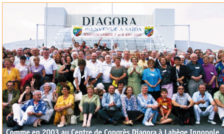
Comme en 2003 au Centre de Congrès Diagora à Labège Innopole