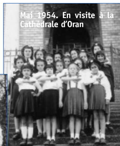
Mai 1954. En visite à la Cathédrale d'Oran

Si l'une d'entre vous a le texte intégral, je serai heureuse de le retrouver, et... de le chanter !... Des photos aussi.