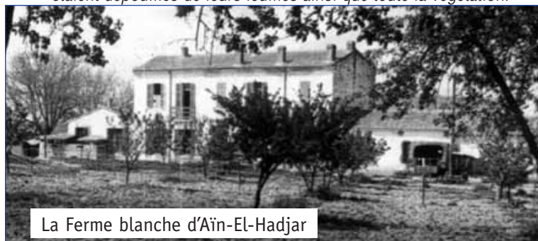
La Ferme blanche d'Aïn-El-Hadjar

- 4 e événement, si cela en est un, fût le nuage de sauterelles qui s'abattit sur Balloul. En deux heures, les arbres étaient dépouillés de leurs feuilles ainsi que toute la végétation.