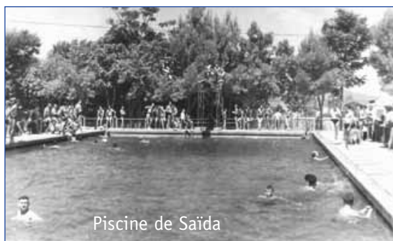
Piscine de Saïda

Une fois libérés, nous avons bien senti à quel point les politiques nous avaient trahis à commencer, par les Harkis, les pieds-noirs, l'armée et les appelés. Face aux commentaires médiatiques sur la guerre d'Algérie, par des commentateurs qui n'étaient même pas nés