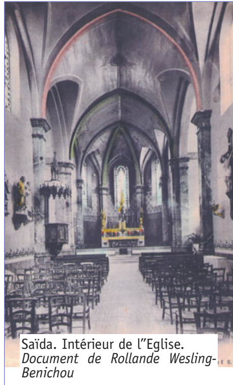
Saïda. Intérieur de l'Eglise.

Après avoir fait installer un cordon de sécurité autour de l'édifice imposant de l'Eglise, le chef d'équipe tint un rapide briefing : « cette église a été laissée par les colons. Nous avons pour mission de la démolir car elle n'est plus