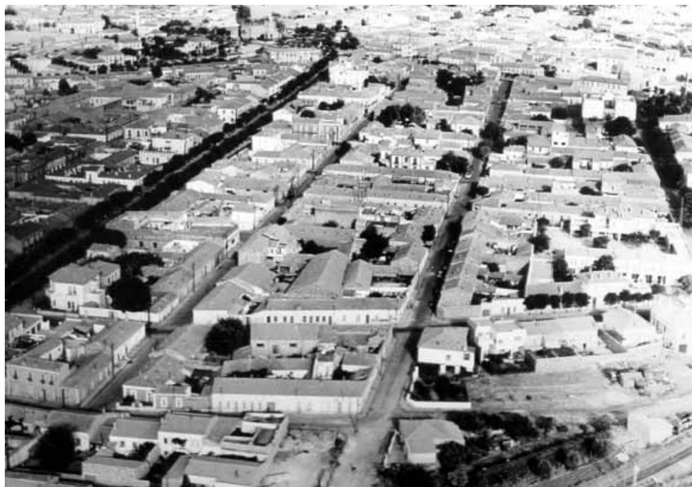
Le quartier de la Rue Delbecque. l'Avenue Gambetta bordée d'arbres, à gauche sur la photo.

Ce dont je suis absolument sûr, et cela jusqu'à la fin de mes jours, c'est que la rue Delbecque aura marqué mes années de jeunesse autant que l'armée celles d'adulte.»