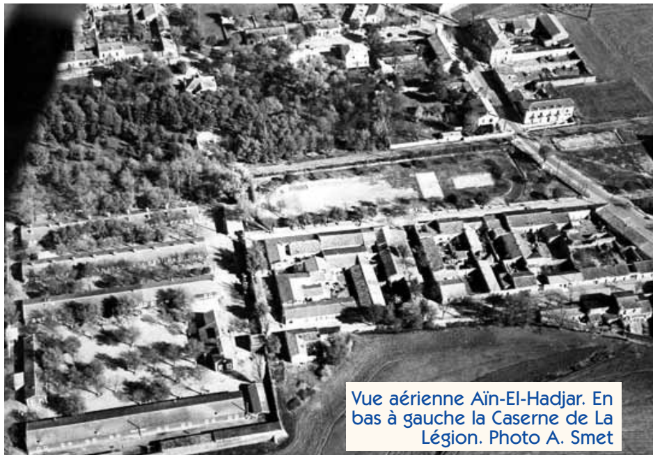
Vue aérienne Aïn-El-Hadjar. En bas à gauche la Caserne de La Légion.

Au moment d'écrire ces lignes le cœur m'étreint