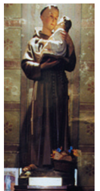
STATUE RAPATRIÉE de l'EGLISE de SAÏDA (Algérie) EN 1962 ET OFFERTE PAR SES PAROISSIENS 17 OCTOBRE 1999

➤ Les autres, restées à Saïda (dans la précipitation de l'exode, toutes n'ont pu être rapatriées), ont été murées dans un lieu tenu secret, pour éviter leur destruction. Elles y sont toujours, veillant dans l'ombre sur les nôtres restés là-bas.