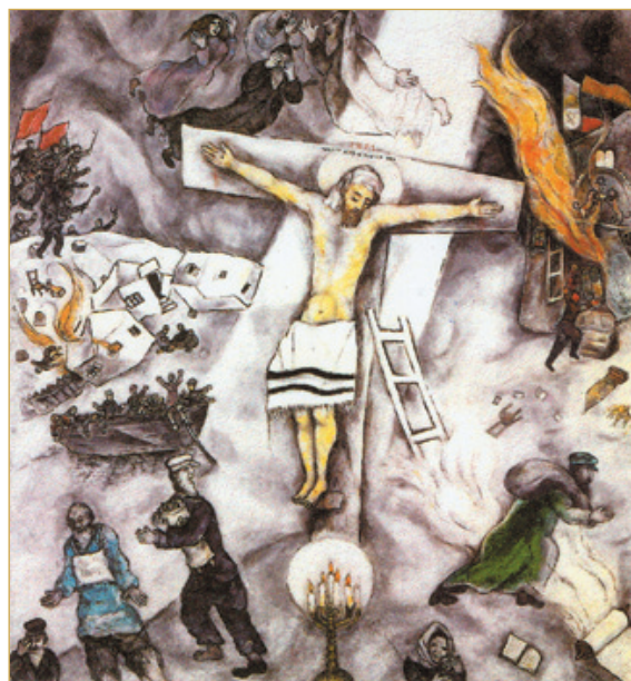
«La Crucifixion Blanche», de Chagall

L'artiste a voulu « englober » en cet être toute la souffrance humaine... souffrance engendrée par l'homme, par tout homme quel qu'il soit.