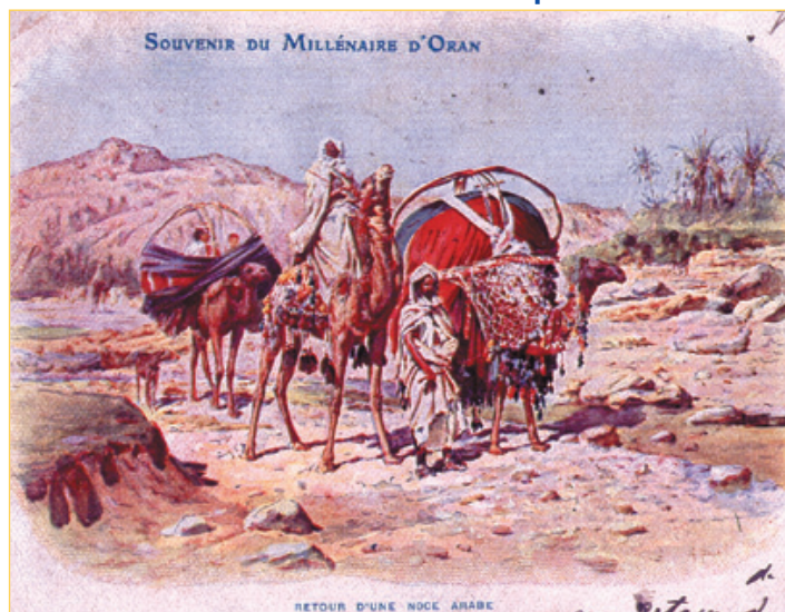
Retour d'une Noce. Collection Jacques Nouchy