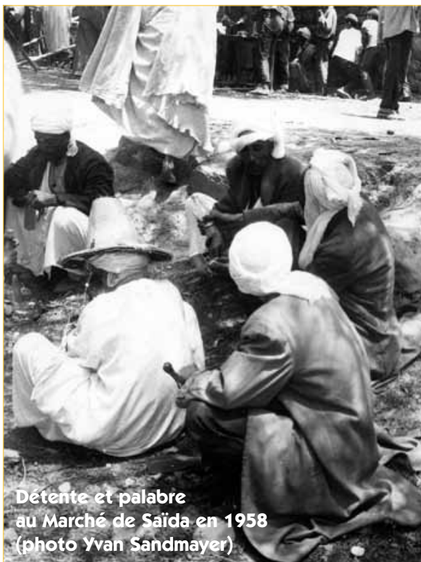
Détente et palabre au Marché de Saïda en 1958

étendue, toutes ces circonstances plaidèrent en faveur de l'amputation ; elle fut faite par M. le docteur Lamonta. Ben Mokhtar guérit avec une rapidité extraordinaire, et un mois après il montait à cheval avec sa jambe de bois et retourna à la montagne. A ce propos, je ferai remarquer que les Arabes, qui aiment beaucoup nos chirurgiens militaires, leur reprochent cependant une chose, c'est d'être trop enclins à faire des opérations ; ils sont en cela de l'avis de Celse « Mala est Medicina in quâ aliquid naturae perit ». « Le traitement chirurgical proprement dit n'est qu'un pis aller, l'ultima ratio de la thérapeutique (cours de M. le professeur Jaumes, 1851). Il est donc à désirer que nos confrères qui exercent leur art en Algérie, s'attachent à faire envers les Arabes cette médecine conservatrice préconisée dans l'école de Montpellier.