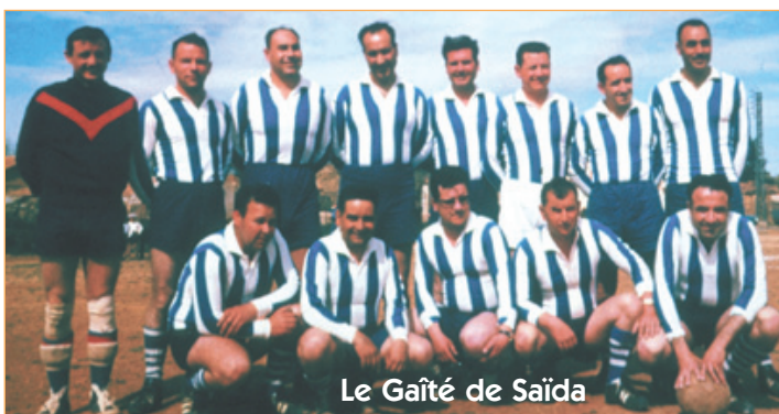
Le Gaïté de Saïda

Nous le savons profondément attaché à l'Algérie et particulièrement à sa ville natale, Saïda, où