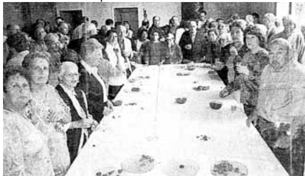
De nombreux convives ont participé à cette rencontre chaleureuse

Pour tous, un grand moment d'amitié qui donnait l'occasion aux aînés d'évoquer les souvenirs communs alors que