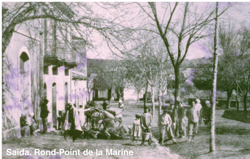
Saïda. Rond-Point de la Marine

Le détournement de l'Oued Oukrif par une large tranchée qui rejoignait le vieux Saïda a bien amélioré la situation. Seules étaient déversées dans le lit naturel les eaux venant de la piscine, des terrains Vidal, Quinto, Fratani, Gerlier etc... puis elles traversaient la marine dans les buses. Malgré toutes les améliorations la « Marine » a conservé son nom... même sèche !»