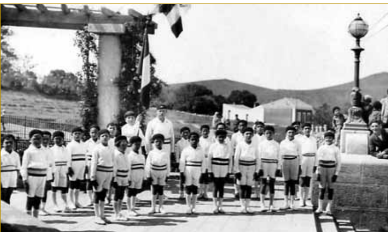
Les Enfants de la «Patriote» saïdéenne au Monuments aux Morts vers 1940.