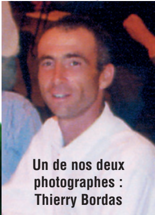
Un de nos deux photographes : Thierry Bordas