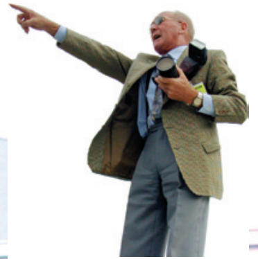
Un de nos deux photographes : Arthur Smet