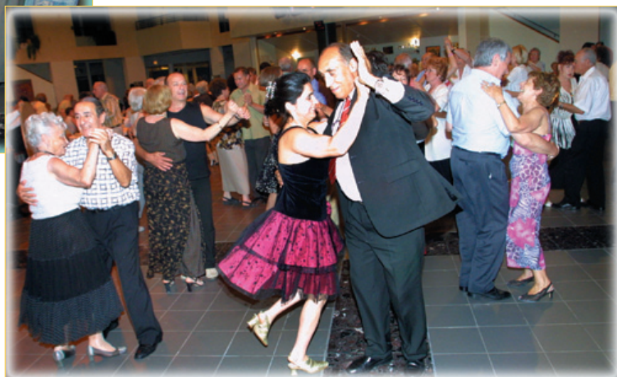
Tayo !... le roi du tango