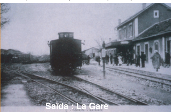
Saïda : La Gare

Pour tous conseils, lui téléphoner au : 04.68.25.13.50, Guy se fera un plaisir de vous guider.