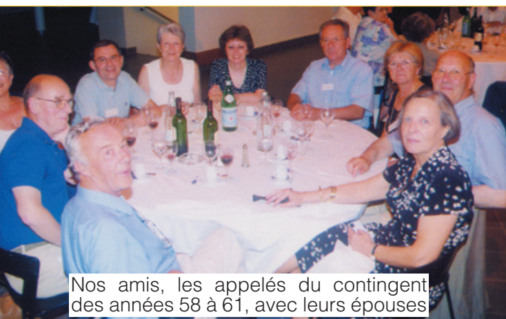
Nos amis, les appelés du contingent des années 58 à 61, avec leurs épouses

Et c'est, comme toujours, à regret, que les derniers Saïdéens se quittaient, heureux de ces deux journées de retrouvailles, le cœur plein de Saïda pour deux ans.