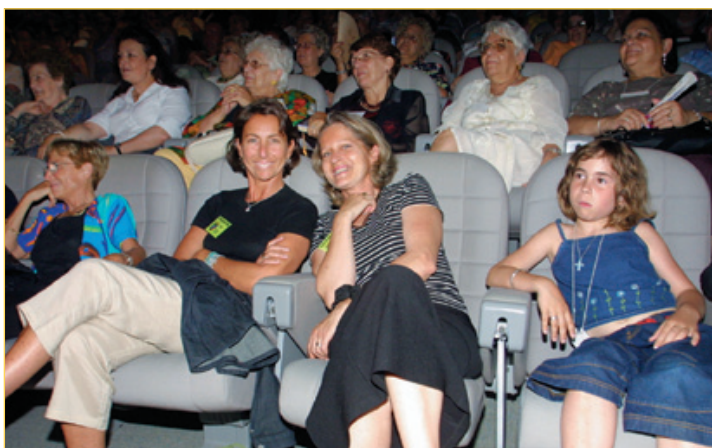
Plusieurs générations confondues, on attend avec impatience le début de la projection de «Saïda, l'heureuse»