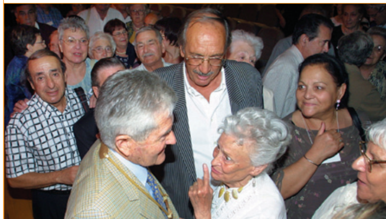
Après l'émotion, les impressions et les larmes

Comme il n'est pas trop tard pour le faire, au nom de tous, je pense, je voudrais lui dire un grand merci.»