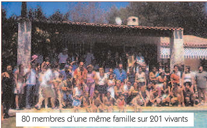
80 membres d'une même famille sur 201 vivants

Les premières retrouvailles commencèrent le samedi à 16 heures. La joie fut d'autant plus intense que certains cousins germains qui se connaissaient enfants, se retrouvaient après