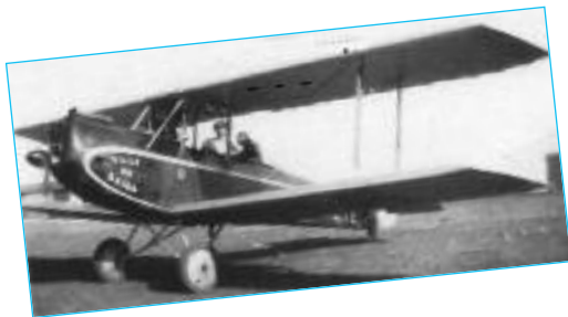
Luciole "Ville de Saïda" F-ALYE