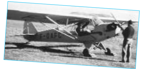
Piper Cub F-OAFC