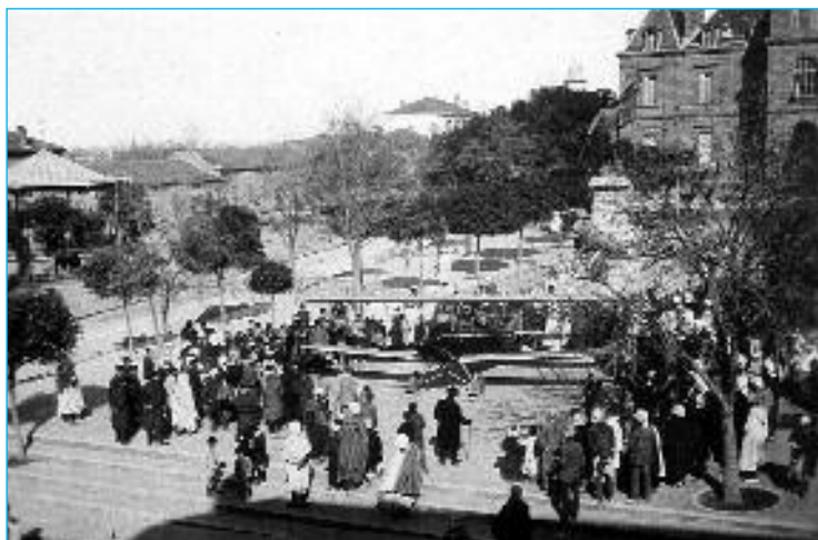
17 juillet 1932 Baptême du "Ville de Saïda" Place de la Mairie.