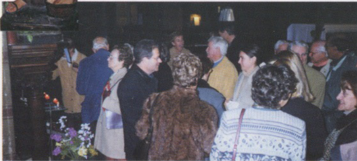
Après la messe, un petit bonjour à notre Saint-Antoine.

Aussi c'est avec beaucoup de joie dans ces retrouvailles et de recueillement dans le souvenir de nos morts, que plus de cinquante Saïdéens ont assisté à cette traditionnelle messe de rentrée. Messe qui avait été préparée en commun par l'équipe liturgique de Notre Dame du Taur et l'équipe Saïdéenne de Sainte Jeanne d'Arc.