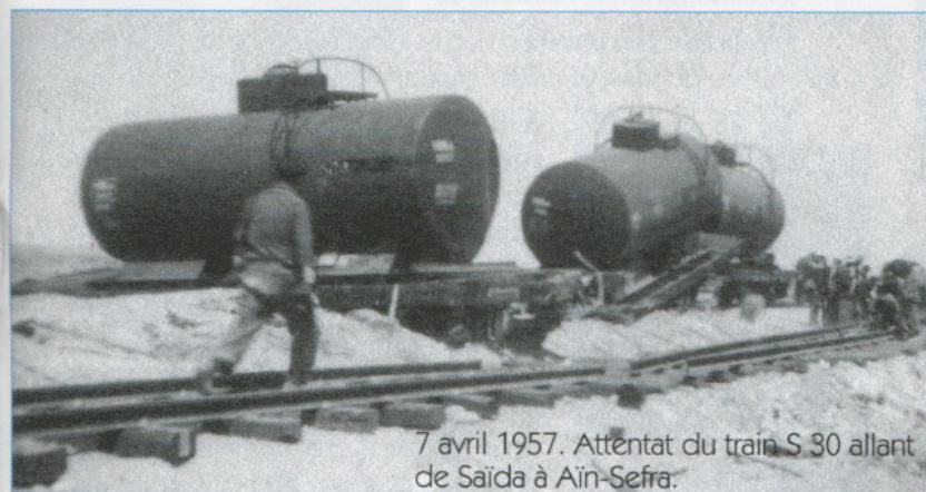
7 avril 1957. Attentat du train S 30 allant de Saïda à Aïn-Sefra.