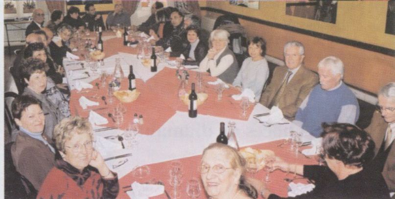
Une belle table de Saïdéens souriants

Mais comme dit le proverbe arabe : « El âaqba li jibek âând hbibak mouné 'hdoura. », en français : « La montée qui te conduit chez un ami est une descente »