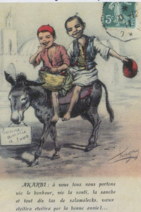
AKARBI : à vous tous nous portons vic le bonheur, vic la santi, la sanche et tout dis tas de salamalecks, vœux etcitira etcitira por la bonne annie!...

Depuis aussi, hélas, nos anciens, pour la plupart, sont partis. C'est leurs générations qui avaient le plus souffert de l'arrachement à notre terre natale, leurs cœurs blessés à mort pour toujours. Oui, disparus nos anciens, mais toujours présents parmi nous après nous avoir laissé un précieux héritage : leur exemple. L'exemple de leur vie