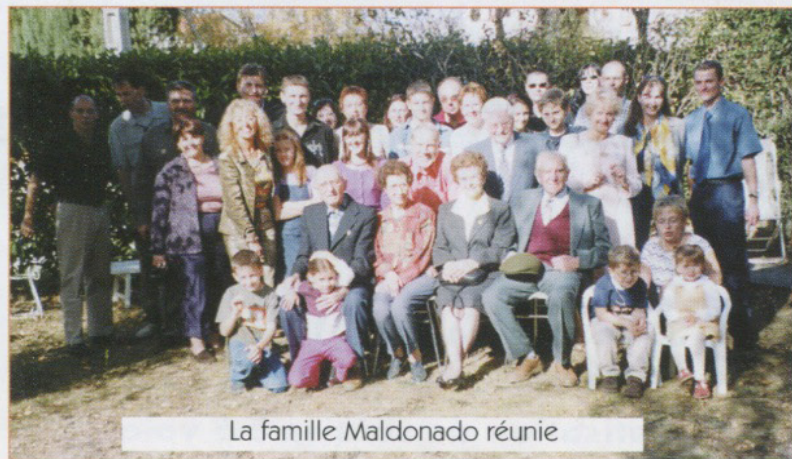
La famille Maldonado réunie

L'Amicale présente ses plus sincères félicitations et encore beaucoup de bonheur.