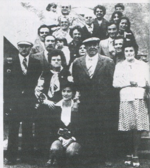
Les époux Soler entourés de leurs enfants et petits-enfants.

extrait d'un article du Journal de Trémentines paru dans les années 80.