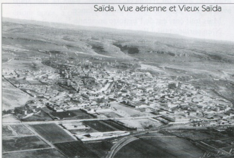
Saïda. Vue aérienne et Vieux Saïda