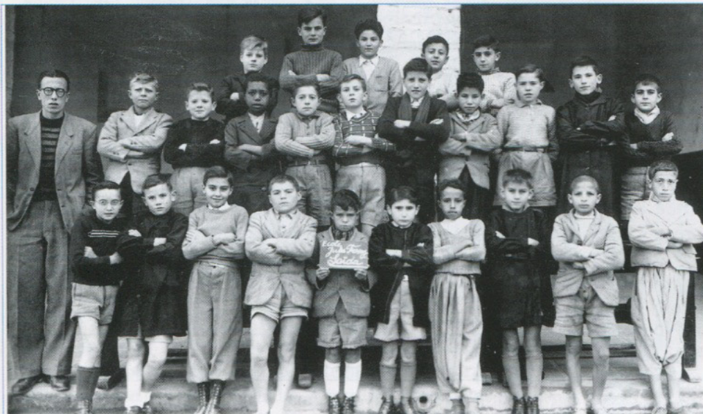
Classe cours supérieur : Ecole Jules Ferry en 46.