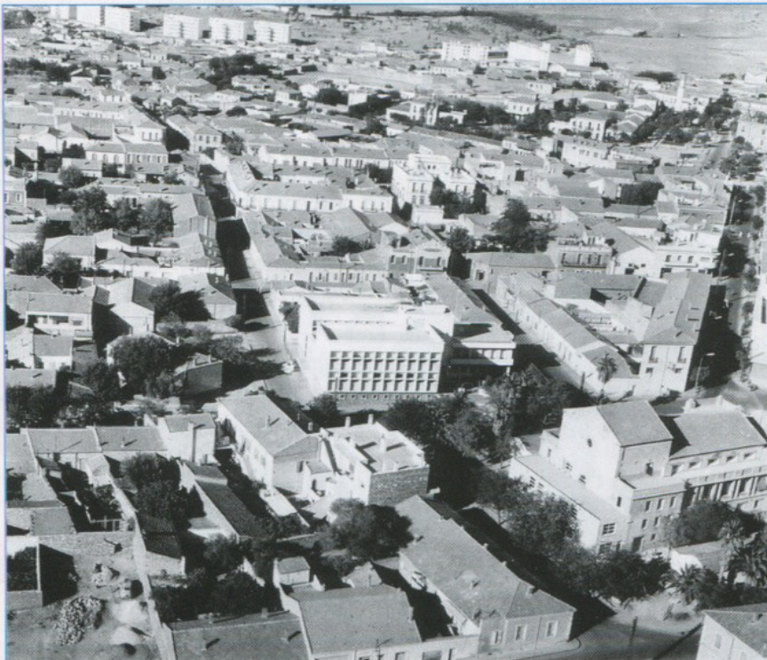
Vue aérienne de Saïda.