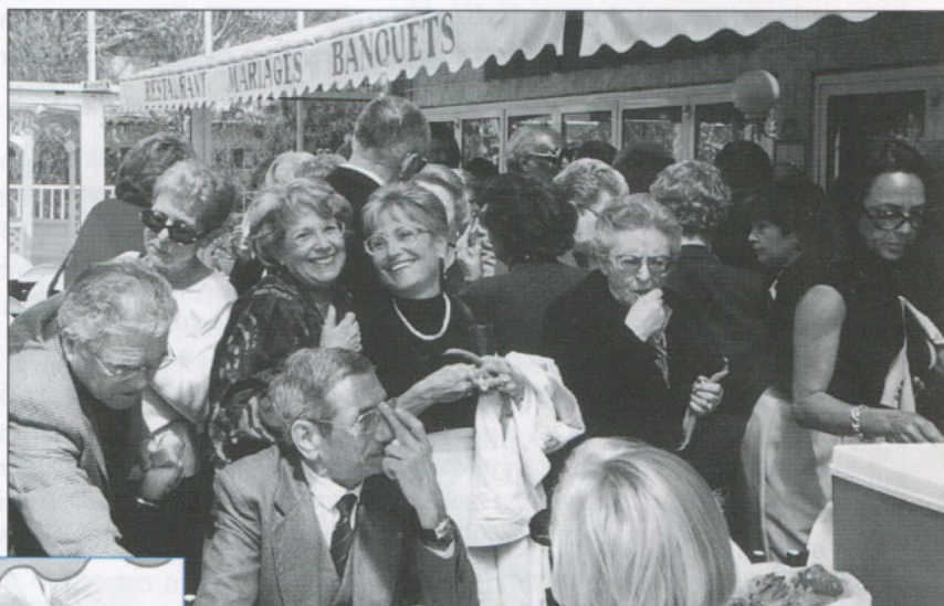
Ça tchatte déjà, à l'arrivée... !

Il ne reste plus qu'à l'équipe du Var qu'espérer vous retrouver nombreux au prochain Rassemblement National des 2 et 3 juin 2001 à Hyères (Var).