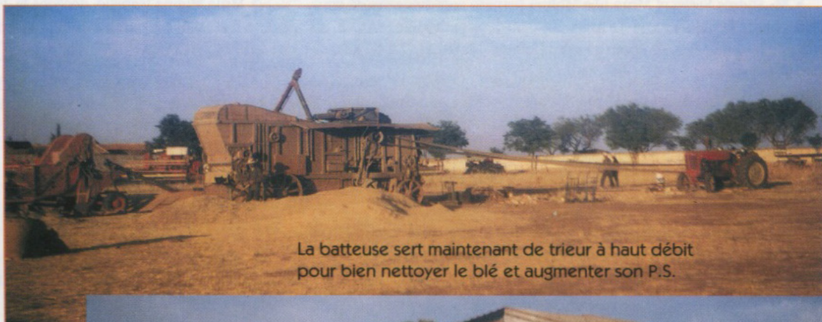
La batteuse sert maintenant de trieur à haut débit pour bien nettoyer le blé et augmenter son P.S.