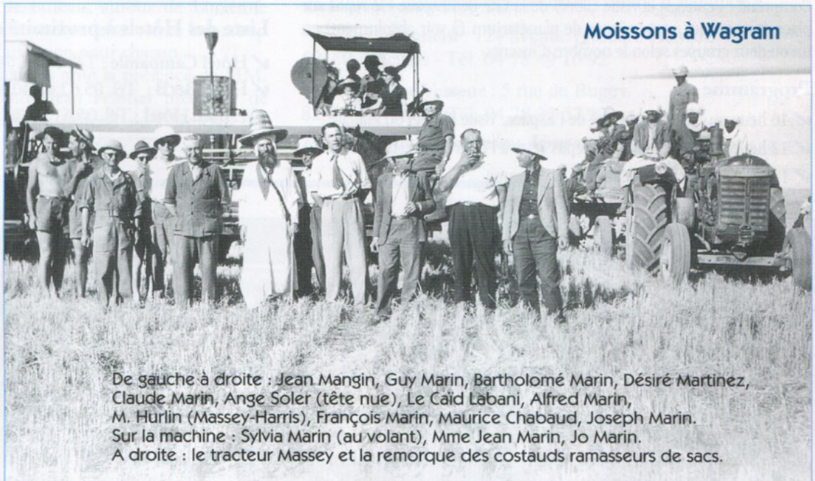
Moissons à Wagram