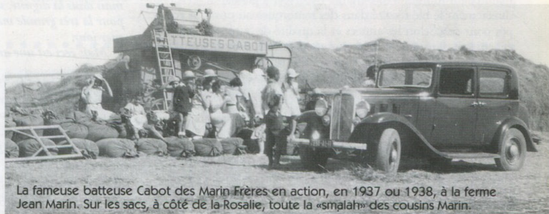
La fameuse batteuse Cabot des Marin Frères en action, en 1937 ou 1938, à la ferme Jean Marin. Sur les sacs, à côté de la Rosalie, toute la «smalah» des cousins Marin.

Pour les enfants que nous étions, insouciant et pleins de vie, cet amoncellement de sacs nous fournissait à l'infini toutes sortes de cachettes, trous et tunnels pour jouer à «couc».