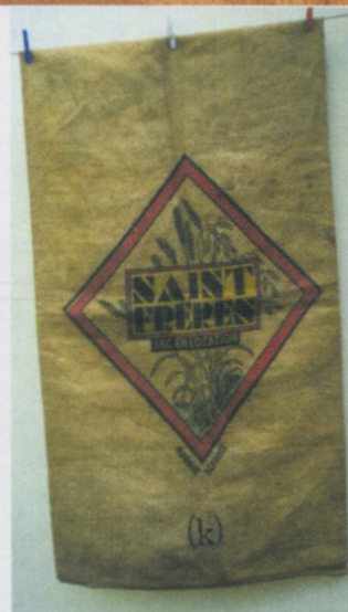
Un sac Saint Frères (neuf)