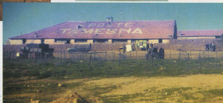
Le Poste de Tamesna