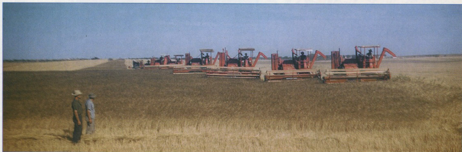
• Été 1957 : Le pool de Tamesna. 11 moissonneuses-batteuses au travail sous la protection du 8 e RIM