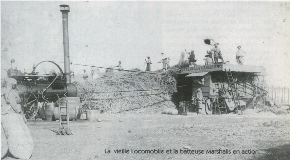
La vieille Locomobile et la batteuse Marshalls en action.

Les «Saint-frères» (2) bien en place, on guettait anxieux l'arrivée des premiers grains que l'on saisissait d'une main fébrile. On le soupesait, dans le creux de la main, en devinant à l'instant s'il «pèserait cette année». Puis l'on étudiait sa couleur, sa grosseur, la «casse», passant la main d'un déversoir à l'autre pour constater le pourcentage de criblure.