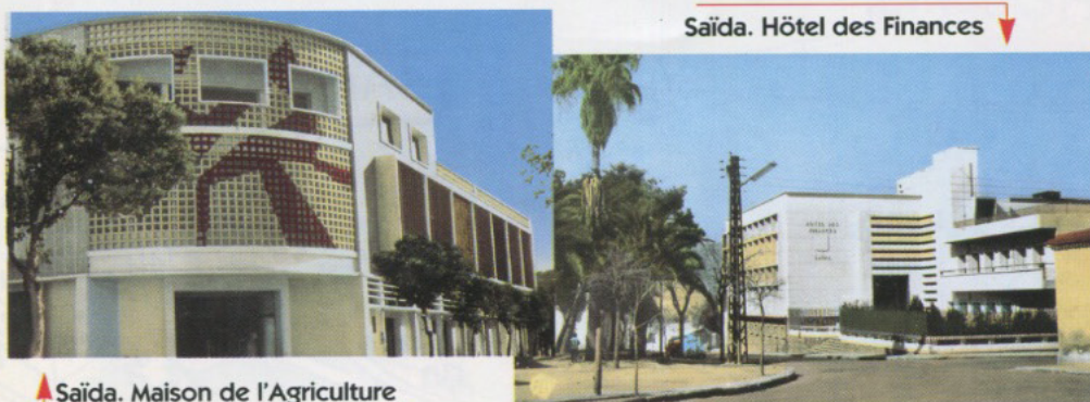
Saïda. Maison de l'Agriculture