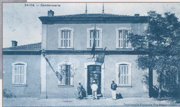
▲ Ancienne Gendarmerie