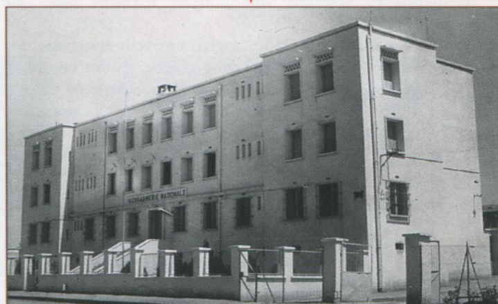
▼ Nouvelle Gendarmerie (1955)

La Brigade de Franchetti a été créée Brigade à cheval en 1892. Elle est passée Brigade à pied par décision ministérielle en 1939. Elle a dépendu des sections de Mascara, puis Saïda lors de sa création le 8 décembre 1955.