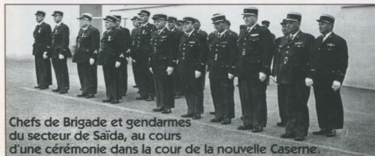
Chefs de Brigade et gendarmes du secteur de Saïda, au cours d'une cérémonie dans la cour de la nouvelle Caserne.

La Brigade d'Aïn-El-Hadjar, a été créée Brigade à cheval et installée officiellement le 5 février 1890. Elle est passée Brigade à pied le 29 juin 1950. Elle a dépendu de la section de Mascara, puis de celle de Saïda lors de sa création le 8 décembre 1955.