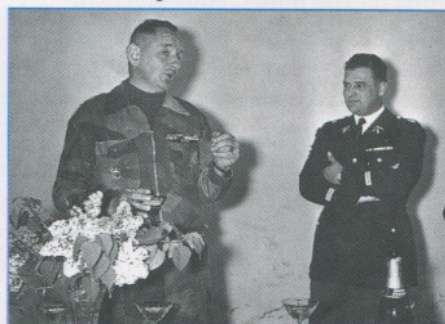
Le Colonel BIGEARD et le Capitaine PUYOU pour l'inauguration de la nouvelle Gendarmerie de Saïda.

L'Amicale et tous les saïdiens, fiers de leur gendarmerie et de ses chefs leur disent toute leur gratitude et leur amicale affection.