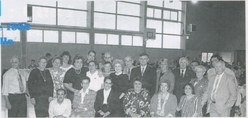
▲ Les bénévoles du bureau ont soigné l'accueil