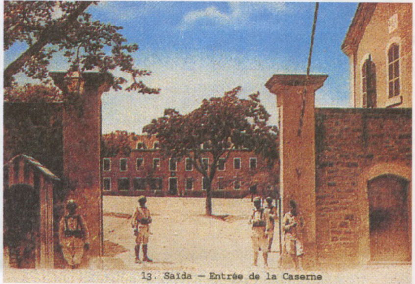
13. Saïda — Entrée de la Caserne