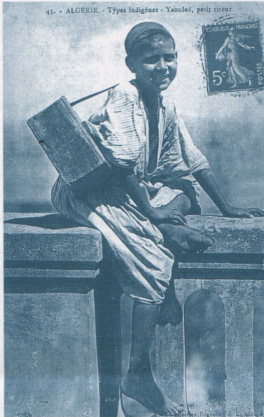
Un petit cireur en 1915

Ta face s'éclaire dans l'ombre du palmier : Tu m'as aperçu de loin, Toi l'enfant espiègle, le grand témoin De la rue, de la vie, du marché.