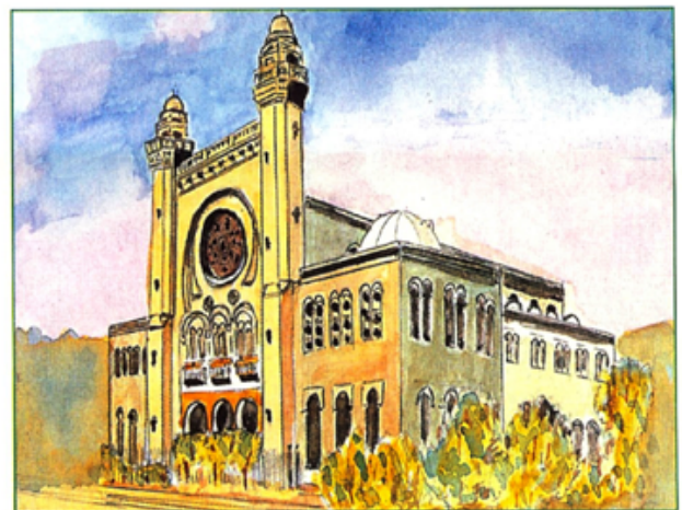
Oran - La Synagogue. Aquarelle : H. PEREZ N'ayant pas de photo significative de la Synagogue de Saïda, nous l'avons remplacée par celle, très belle, d'Oran.

BONNES FÊTES À TOUS... ET N'oubliez PAS... LA MOUNA