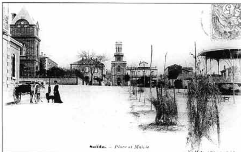
Saïda. — Place et Mairie

• Très rare photo de 1906 avec la Mairie, l'Eglise, le Kiosque à musique et une partie de l'Ecole de filles. La Poste (à droite) n'existait pas encore.