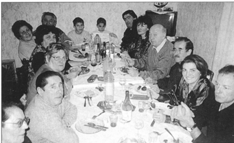
• Journée « Migasses » du 18 janvier dernier. Réunion du Bureau de la région Lyonnaise. (Photo ci-dessus)