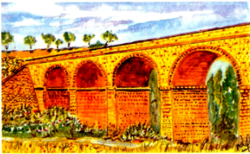
• Le Pont du Vieux Saïda. (Aquarelle de Henri PEREZ).

Notre joli pont de pierres A tout jamais, comme un lierre Sera attaché à notre mémoire Plus grandiose qu'un château de la Loire.