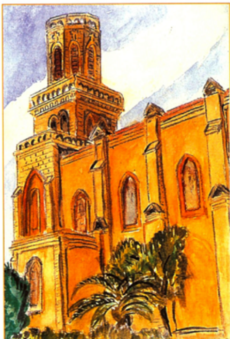
Saïda - L'Église Sainte Jeanne d'Arc qui n'existe plus. Aquarelle : H. PEREZ

Vous êtes, en effet, très nombreux à avoir répondu à notre appel lancé sur le « Devoir de Mémoire ». Vous nous avez conforté à poursuivre dans cette direction, à maintenir, bien sûr, la rubrique « Souvenirs de là-bas » et à la développer.