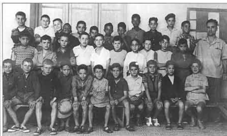
Ecole laïque de garçons Classe de M. Eugène TORRES.

Ces photos nous ont été envoyées sans les noms des élèves. Chacun reconnaîtra les siens... 50 ans après parfois pour certaines