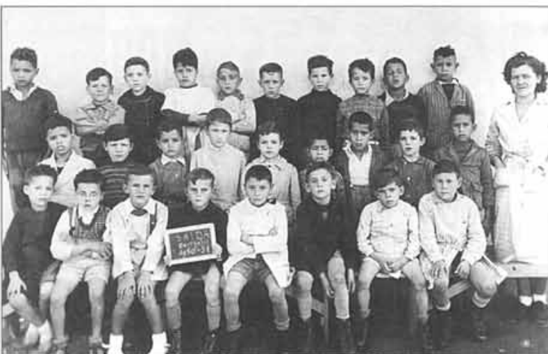
Ecole de garçons Berthelot - 1950-1951