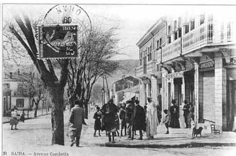
SAÏDA. — Avenue Gambetta

• Très rare photo de 1906 avec la Mairie, l'Eglise, le Kiosque à musique et une partie de l'Ecole de filles. La Poste (à droite) n'existait pas encore.