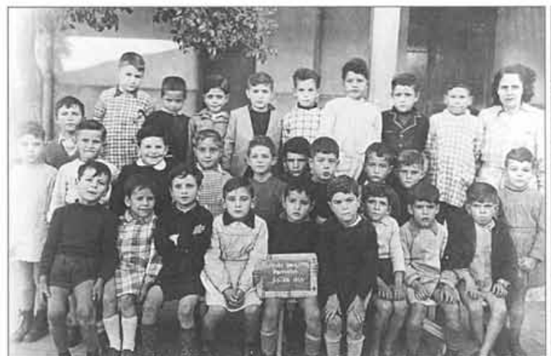
Ecole de garçons Berthelot - 1949 Classe de Mme BENICHOU.

Ces photos nous ont été envoyées sans les noms des élèves. Chacun reconnaîtra les siens... 50 ans après parfois pour certaines