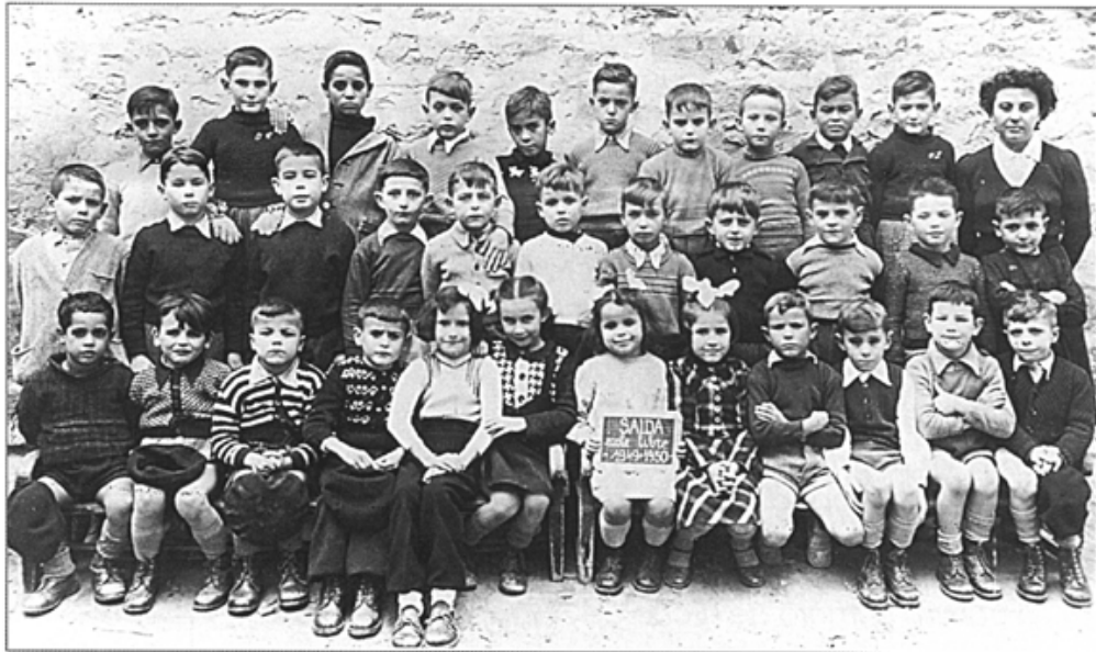
Ecole Félix Faure - CE1 - CE2 - Octobre 1949

Bon courage pour la suite et bonne année 1998 pour vous -mêmes, vos familles et tous nos amis Saïdéens. »