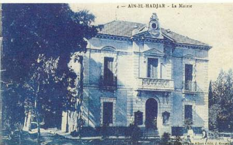
A Aïn-El-Hadjar - La Mairie