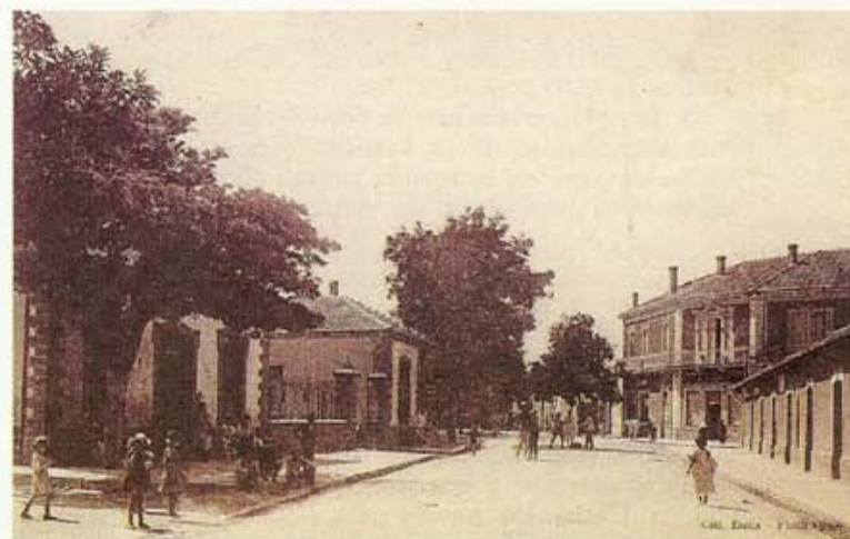
Aïn-El-Hadjar - La Rue principale