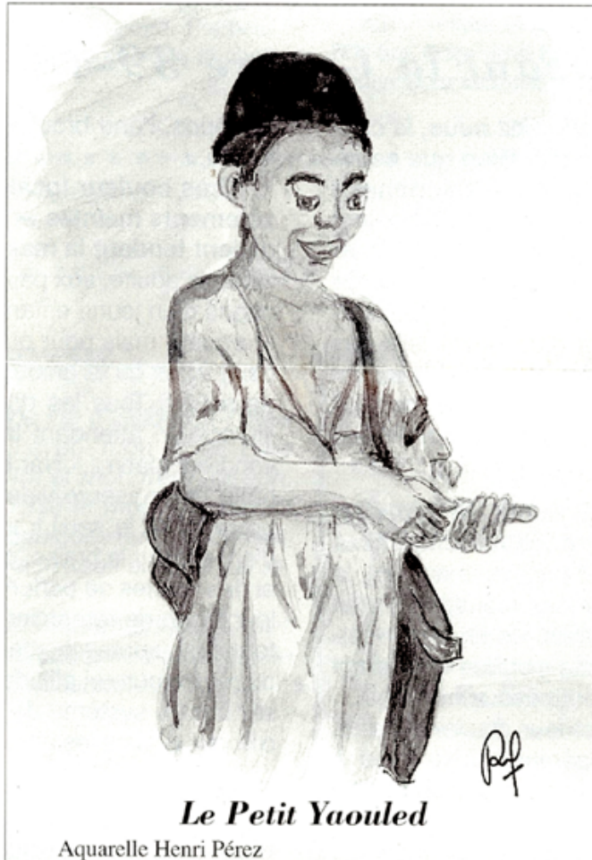
Le Petit Yaouled