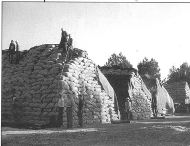
• Dans les années 50. Une récolte exceptionnelle, des silos pleins. On fait des meules de sacs à la Coopérative... pour la plus grande joie des souris de Bou-Rached.

Petite exploitation qui montre cependant qu'avec de la patience et un effort soutenu une industrie peut vivre ici.»