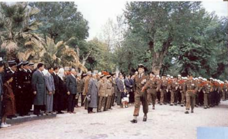
• Le 11 novembre à Aïn-El-Hadjar. Une compagnie de la Légion Etrangère défile devant les autorités civiles et militaires et la population du village.