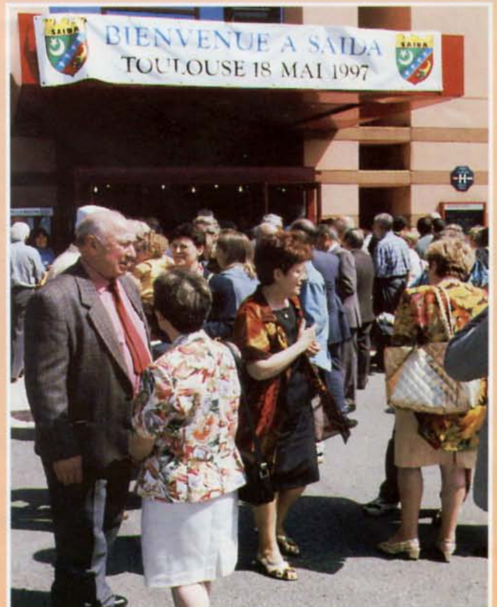
• Les premiers arrivants sous la banderole de Bienvenue