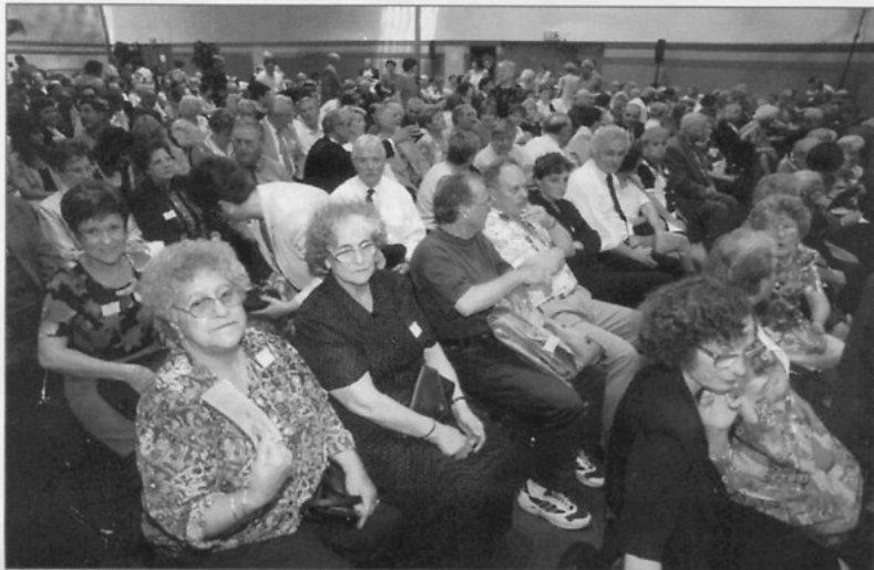
• Vue sur une partie de l'assistance, le spectacle va bientôt commencer...

Deux heures de rire et de détente dans une ambiance toute amicale et décontractée.