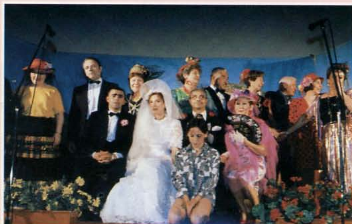
• Un mariage haut en couleur avec les comédiens du Théâtre Pied-Noir