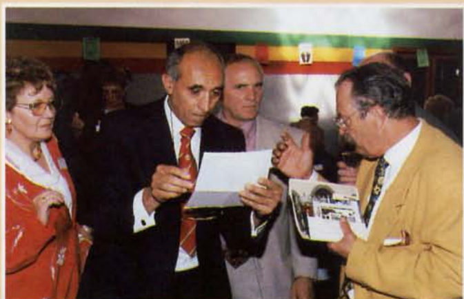
• J'te dis qu'c'est lui ... !