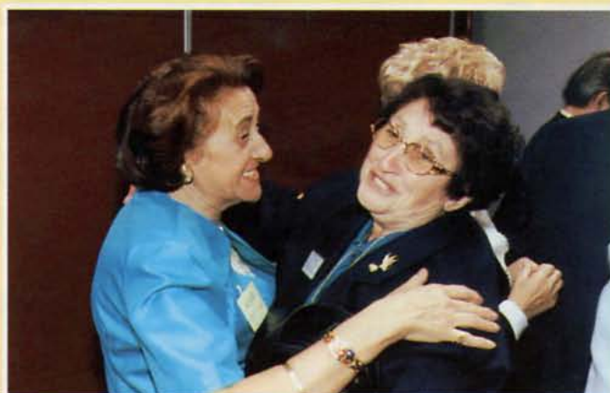
• On se trouve...