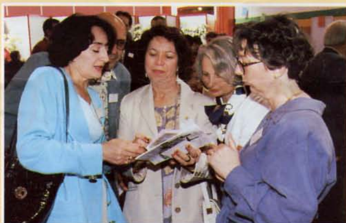
• On se montre les photos souvenirs...