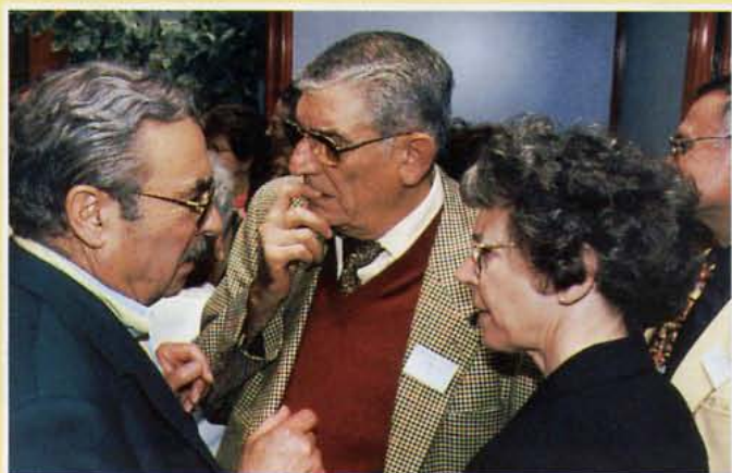
• On se cherche...