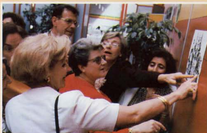
• J'te jure, t'ias pas changé...!