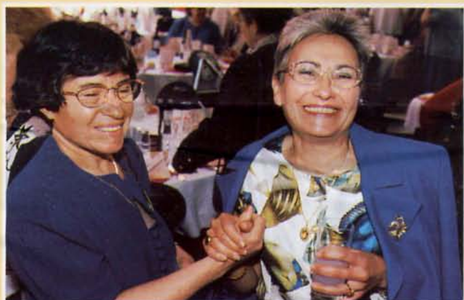
• Nous sommes heureuses...