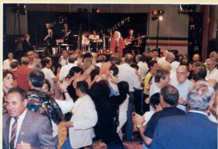
• On a dansé jusqu'à deux heures du matin...