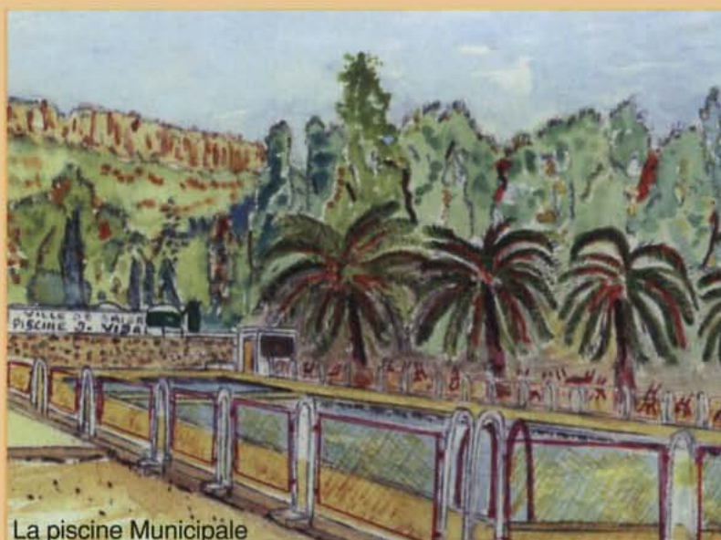
La piscine Municipale

35 ans “ après ” 700 Saïdéens au rendez-vous de l’Amitié