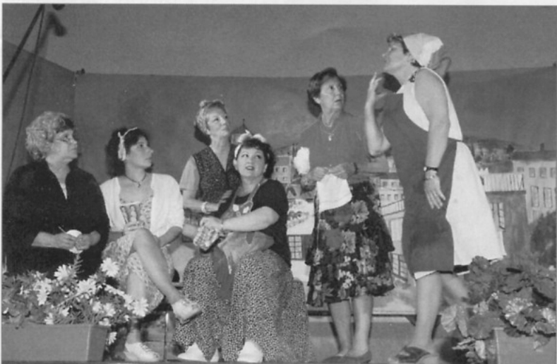
• Une scène sans hommes ... Qu'est-ce qu'ils ont pas pris les pôvres !