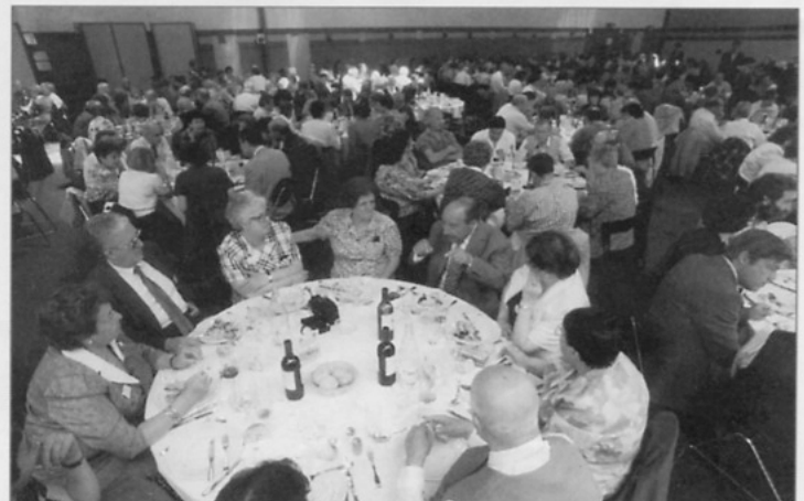
• Des tables bien animées pendant le repas...