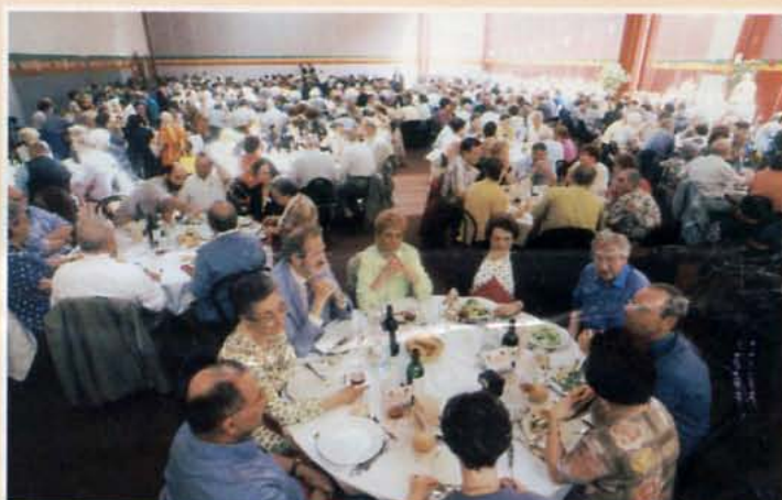
• Une partie de l'assistance pendant le repas.