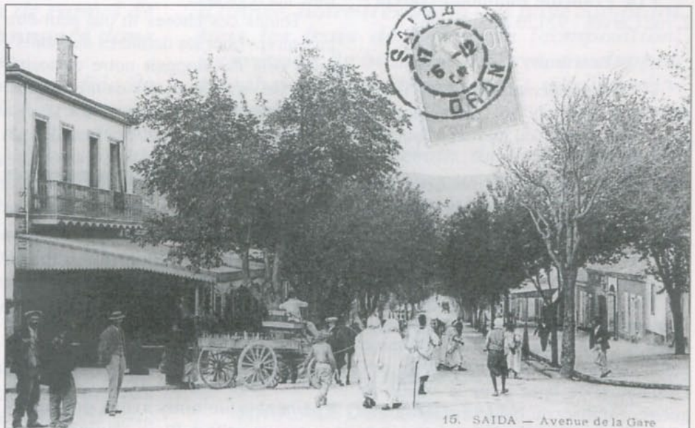
• Avenue de la Gare et par la suite Avenue Gambetta - Carte postale de 1912

* Chèque à l'ordre de : AMICALE DES SAÏDÉENS 13, RUE DES ACACIAS 31650 SAINT-ORENS