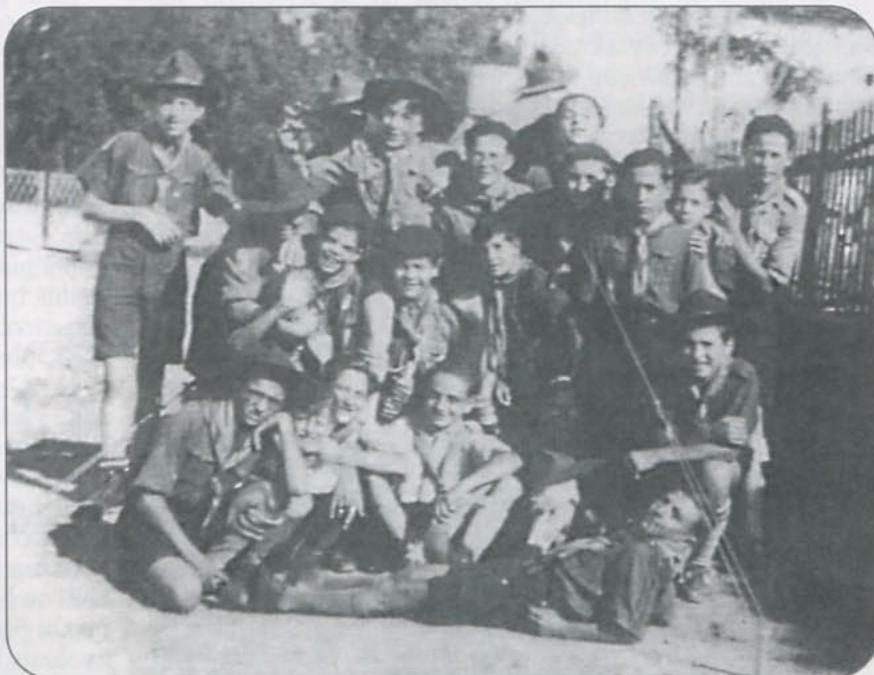
• Les Scouts de France de Saïda en 1940 - Vous reconnaissez vous ?