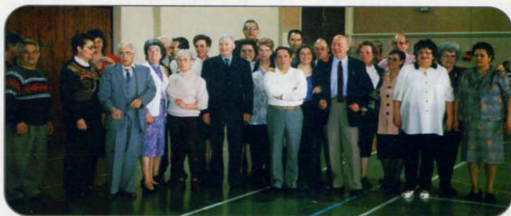
L'équipe Lyonnaise pour la photo souvenir

Après le Champagne (compris dans le prix du repas) l'après-midi s'est terminé avec les Rumbas, les Pasos, les Tangos, afin de soigner les "lumbagos" !!!