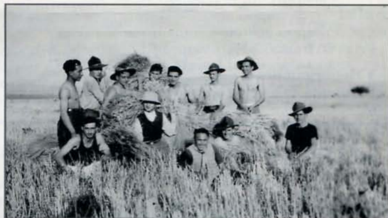
Les Scouts de France à Saïda aux moissons