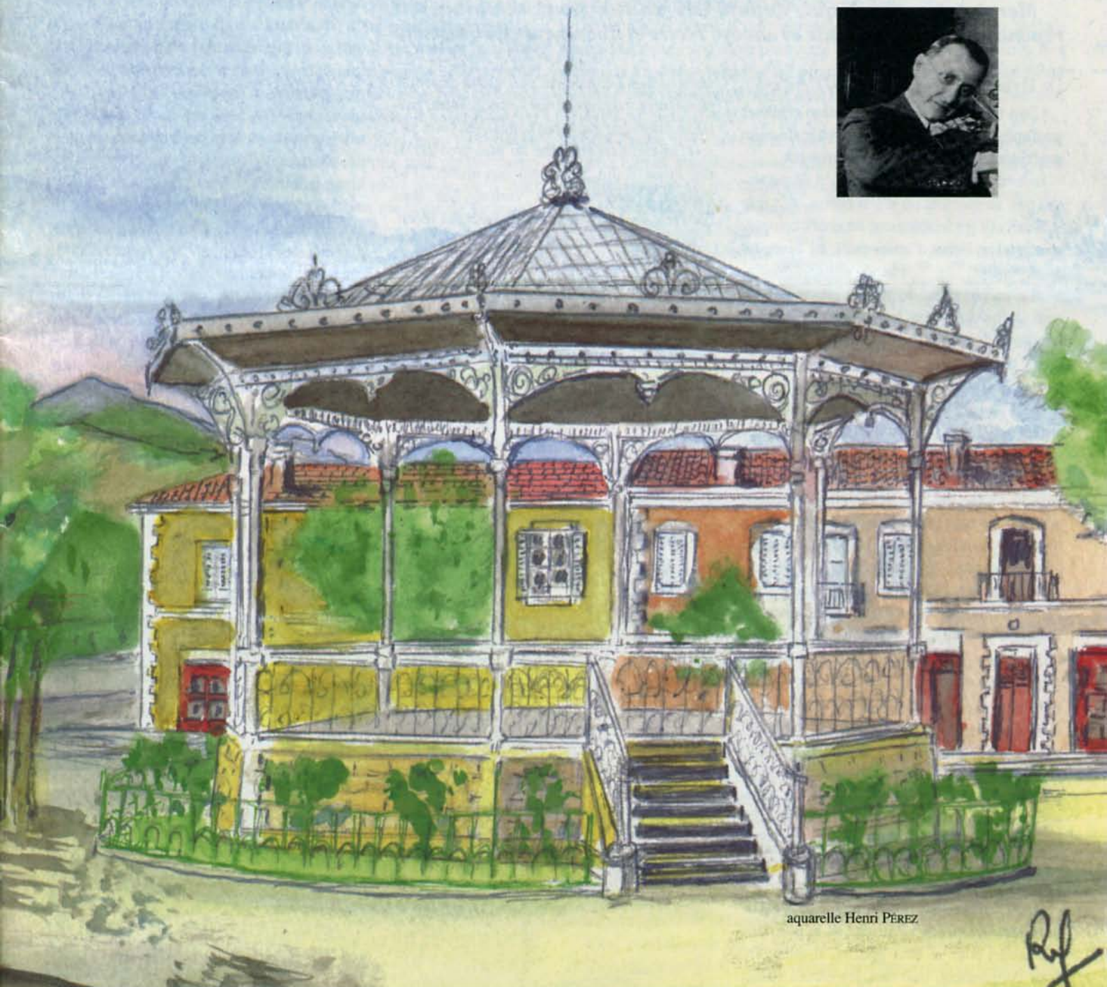
aquarelle Henri PEREZ