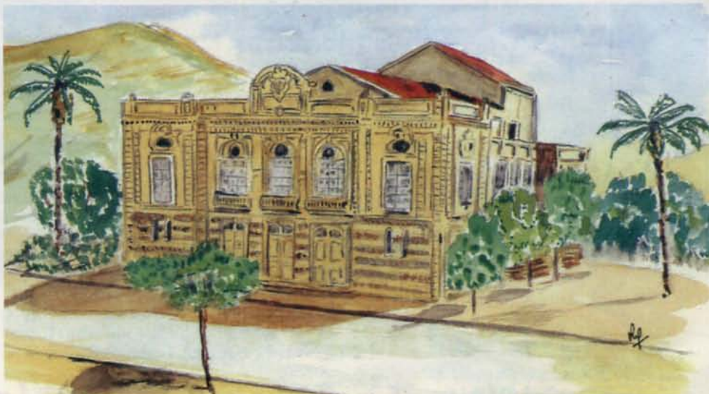
• Le Théâtre de Saïda - Aquarelle de Henri Pérez