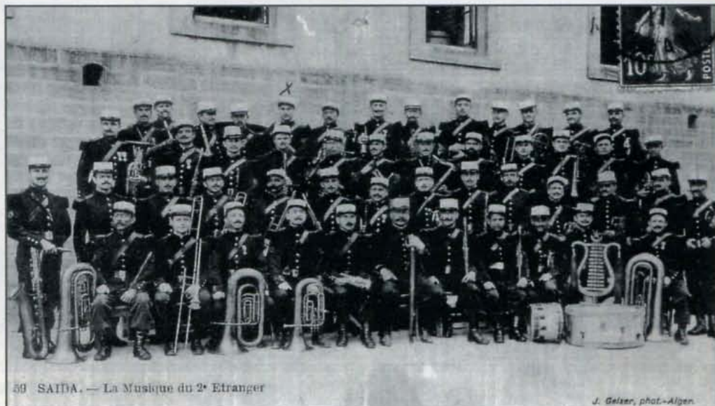
59 SAÏDA. — La Musique du 2 e Etranger

Tout de même, une si petite ville comme Saïda et avoir deux orchestres !