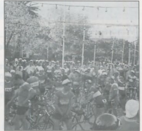
Les concurrents attendent le départ