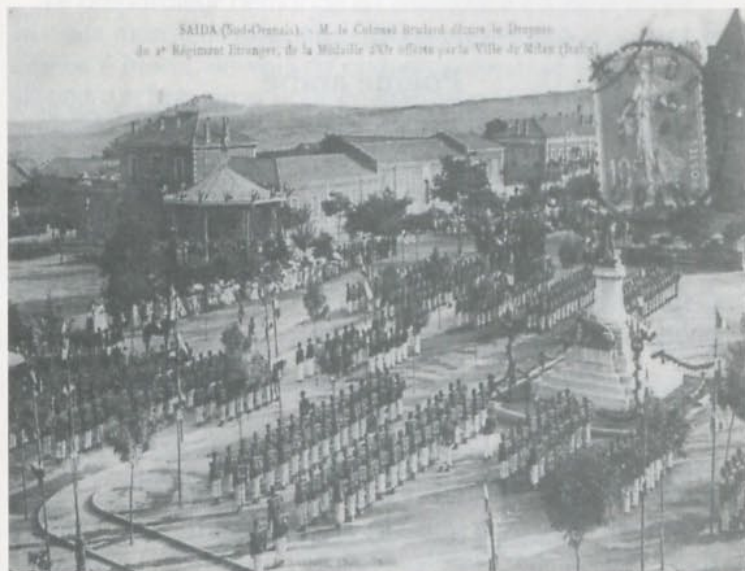
Le Colonel Brulard décore le drapeau du 2ème Etranger sur la Place de Saïda après la Campagne d'Italie.

Toutes nos félicitations pour ces brillantes distinctions.