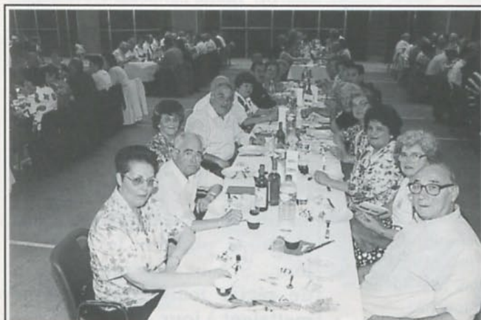
Le gang des Lyonnais !!