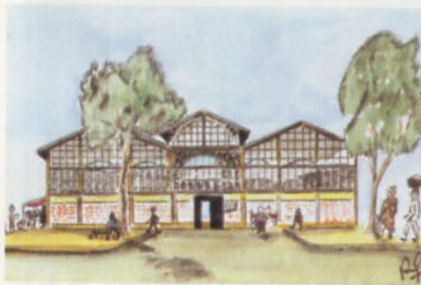
Le Marché couvert de Saïda