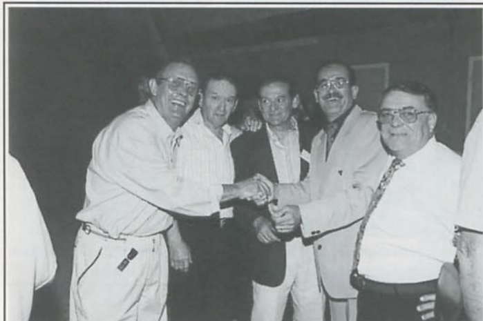
Salut les copains...