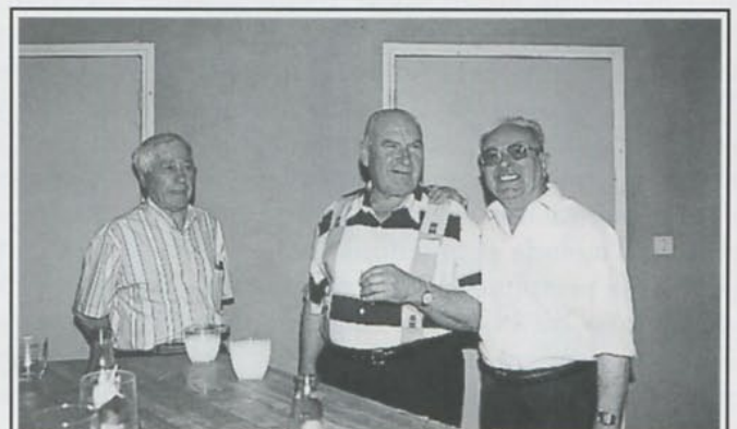
A l'apéritif, Cristal ou Super ?