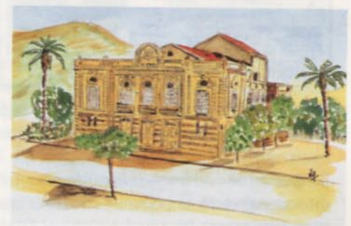
Le Théâtre de Saïda