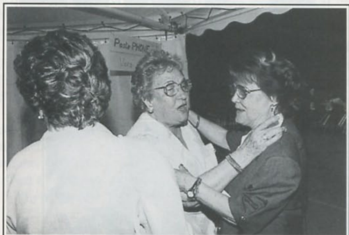
«Il y avait tellement longtemps...»