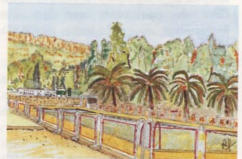
La piscine de Saïda