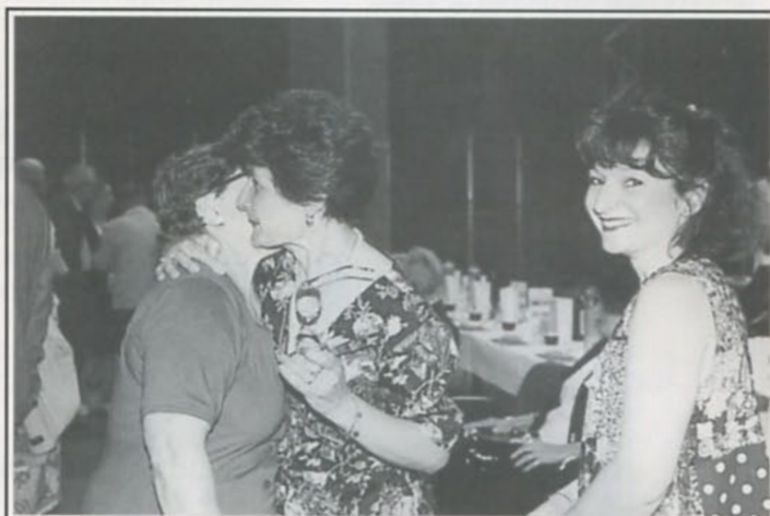
«Qu'est ce que ça fait plaisir...»