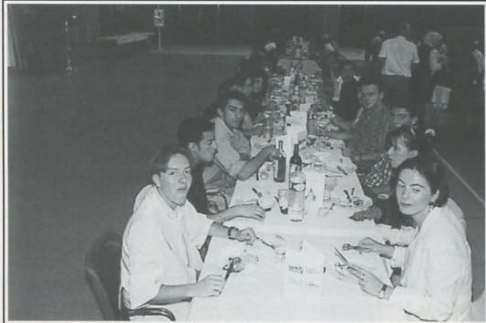
Qui a dit qu'il n'y aurait que des vieux... ?