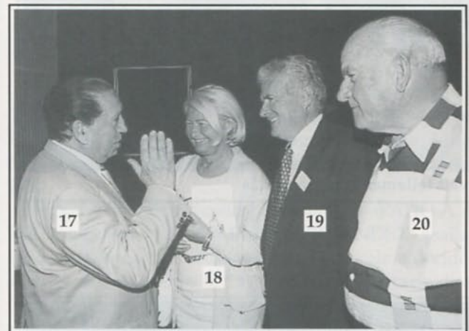
Même le Maire de Hyères...