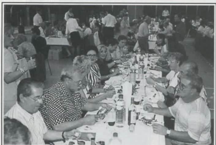
Une table bien animée...