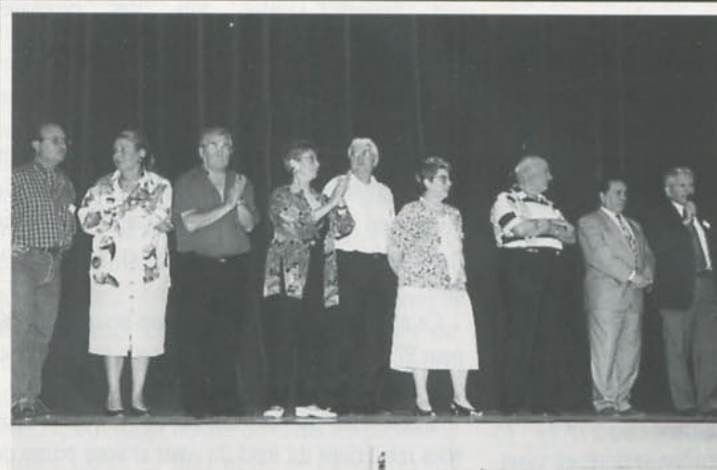
L'équipe organisatrice (il en manque quelques uns) pendant les allocutions de bienvenue et de remerciements.

. Et toutes les bonnes volontés non prévues, non citées ci-dessus, qui ont spontanément «donné la main», en particulier pour la collecte des tickets-repas du dimanche midi.