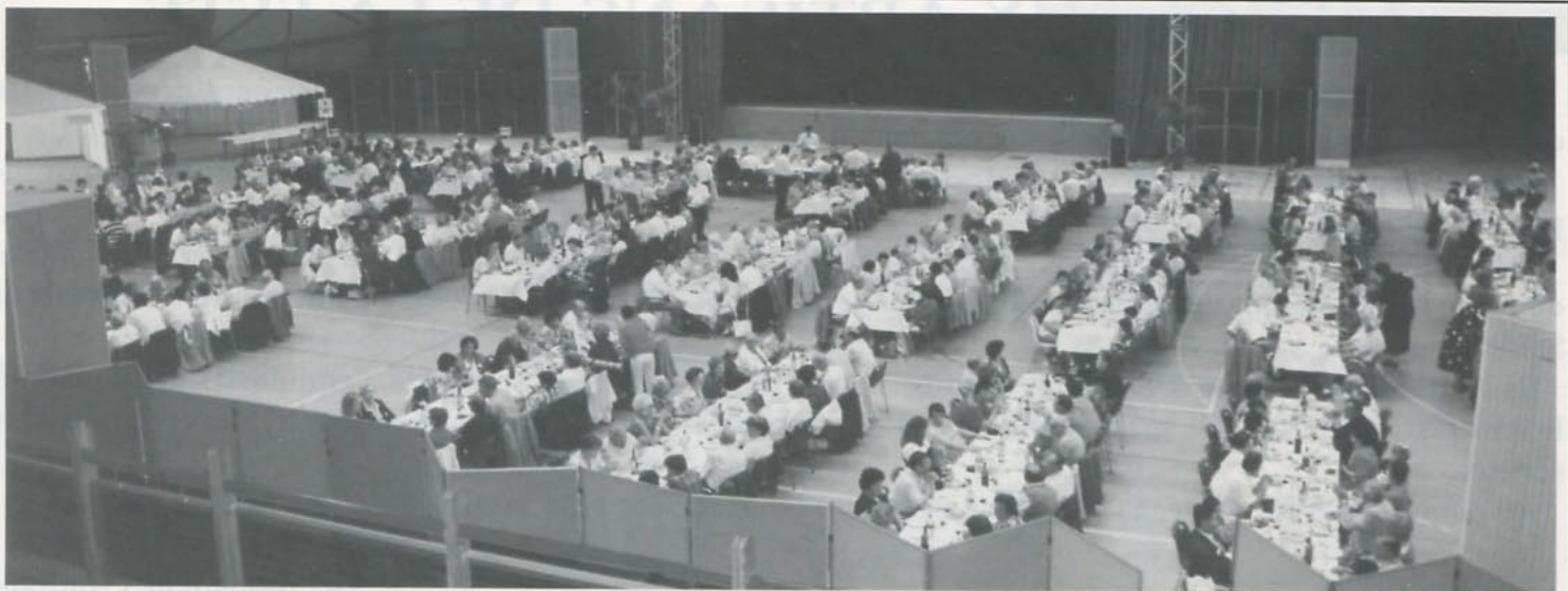
Vue partielle de la magnifique salle pendant le repas de midi.