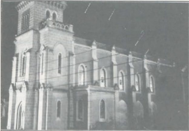
• Eglise de Saïda - Juillet 1950, à 22 h 30.

Bonne fête à tous, et que le nouvel An soit heureux et bénéfique pour toutes nos familles.