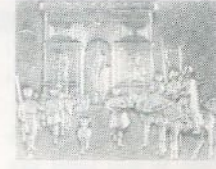
25 août 1944 : Libération de Paris