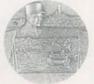
Débarquement en Provence