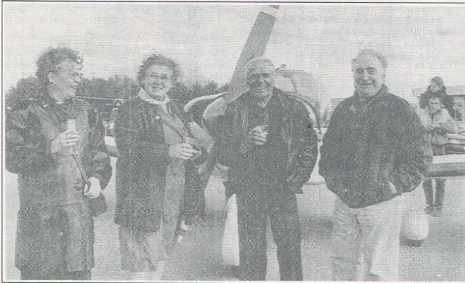
• 52 ans après, les retrouvailles de deux amis

Les deux amis d'enfance ne parlaient plus d'aéronautique, de La Provence, de la l'A.F.N., mais de là-bas... de leur petite ville Saïda. Saïda qui elle, est restée... là-bas. »