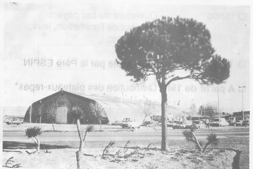
Une vue du Palais des Expositions où nous nous retrouverons