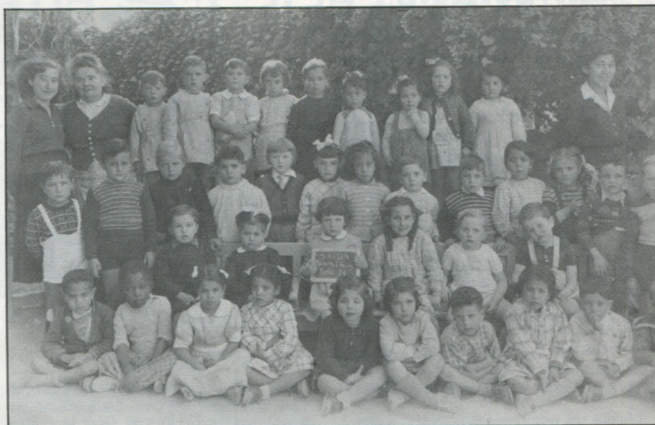
A l'école maternelle Square Flinois en 1950.

Les rapatriés qui atteignent l'âge de 90 ans après le 1.01.1989 percevront la totalité de l'indemnité leur restant due. Ceux qui atteignent l'âge de 80 ans après le 1.01.1989 pourront demander que l'indemnité restant due soit remboursée au maximum en 3 ans selon l'échéancier applicable à cette clause d'âge.