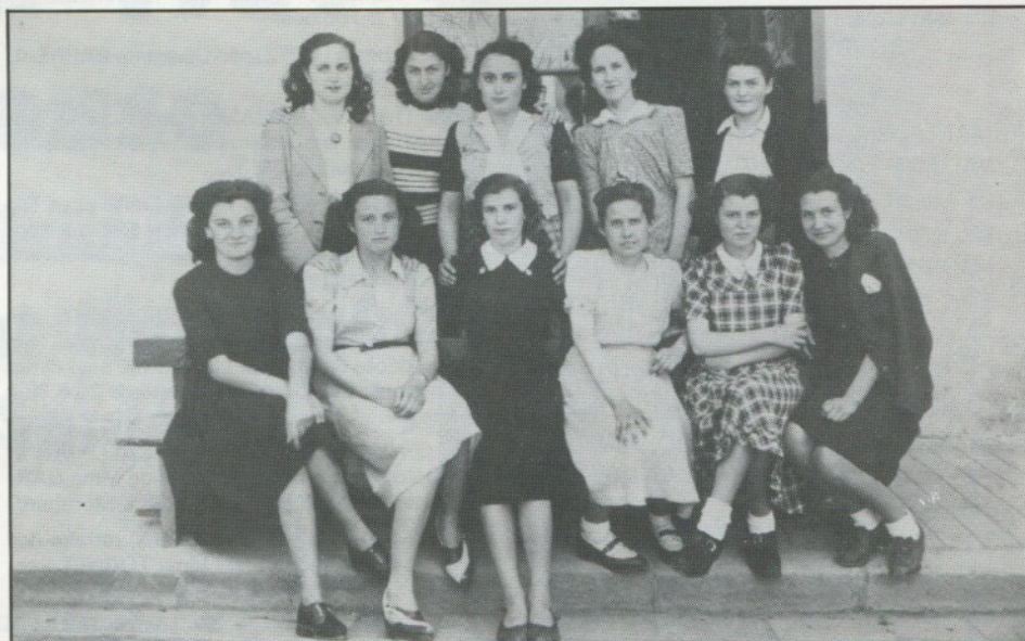
La classe de quatrième en 1948.