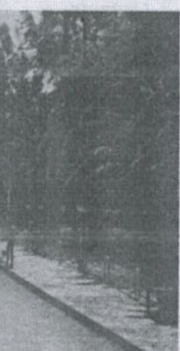
Saïda : la piscine municipale.