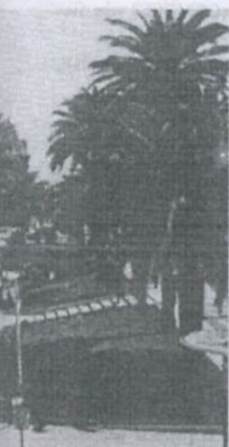
Saïda : la mairie et sa place.

Mais elle a sous estimé les difficultés de main d'œuvre rencontrées sur place. Malgré les assurances reçues elle a dû envoyer des recruteurs dans toute l'Algérie et demander l'autorisation de faire venir des travailleurs tunisiens, et engager de nombreux portugais pour constituer les ossatures !