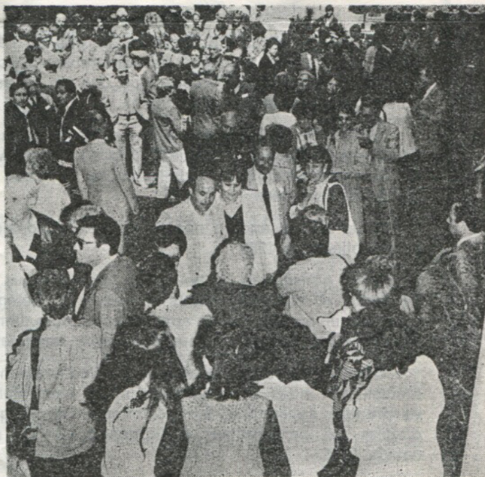
VUES DE LYON