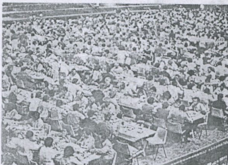
Ci-dessus : La réunion de Mâcon en 1977, et ci-contre, de haut en bas, celle de Toulouse en 1979 et celle de Montpellier en 1981.