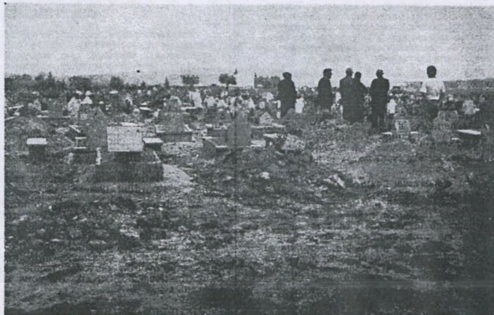
Les trois communautés, par-delà les épreuves et les peines, unies dans le souvenir de leurs morts qui reposent dans une même terre.