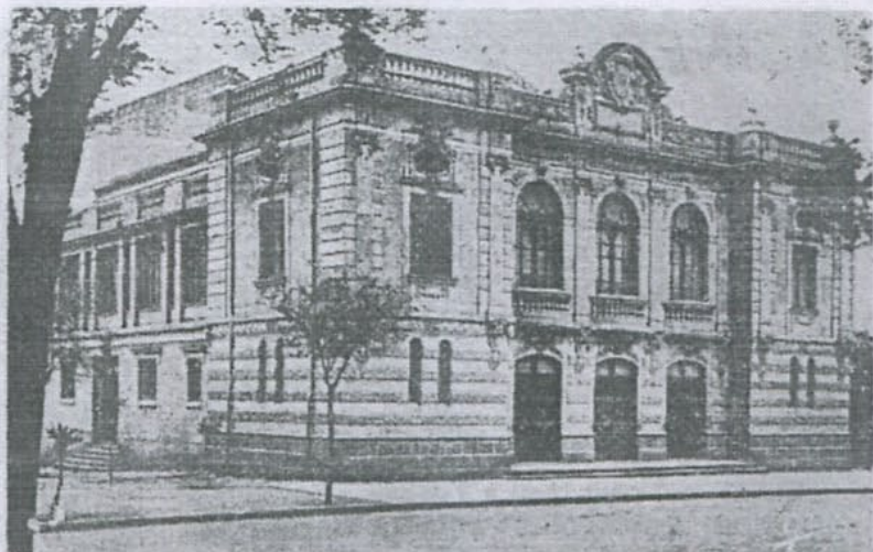
L'ancien théâtre de Saïda.

La décision dépend de vous. Faites retour immédiat de la fiche d'engagement accompagnée des arrhes de 500 F par personne et d'une enveloppe timbrée avec votre adresse et prévoyez le versement