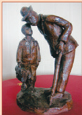
Une réalisation de Marcel Martinez