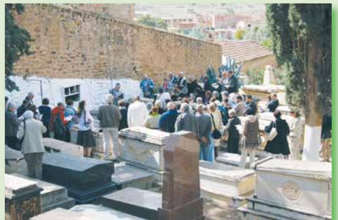
Photographie prise lors du voyage 2010 à Saïda