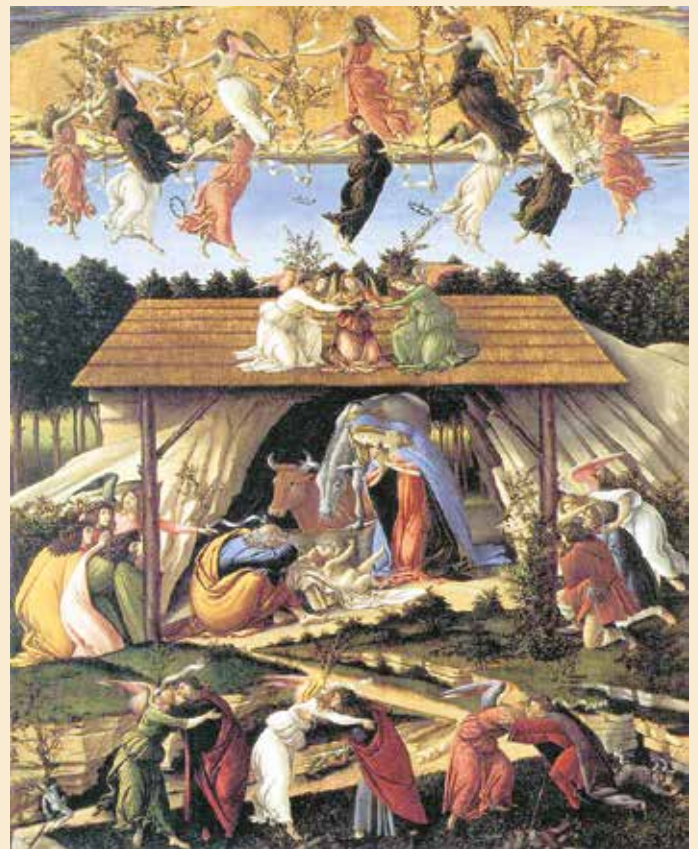
Ci-dessus le tableau « Nativité mystique » de Sandro Botticelli (peint dans les années 1500-1501)

Que Noël soit un temps de paix, de joie et d'amour pour tout le monde