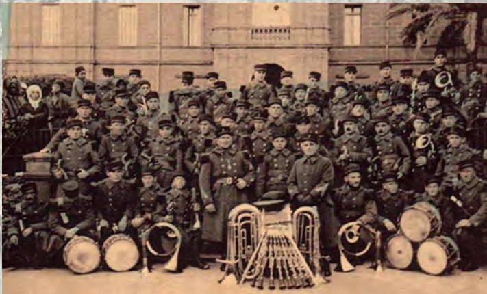
Musique du 1er RE devant la Mairie