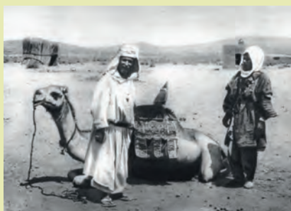
En compagnie d'un touareg

Dès 1882, Charles de Foucauld s'installe à Alger pour étudier l'arabe, l'Islam ainsi que l'hébreu et se prépare à explorer le Maroc, où il se rend en 1883-1884 déguisé en juif local et vivant comme un pauvre afin de