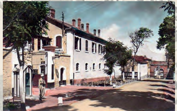
Entrée de la caserne