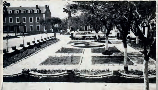
Jardin à l'intérieur de la caserne