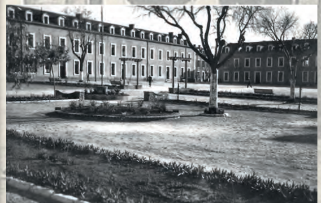
Intérieur de la caserne