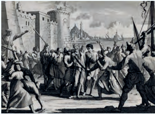
Capture de chrétiens en Algérie

allant du VIIe au XXe siècle. Par son ampleur, sa dureté et sa durée, la traite des noirs était la plus importante. Avant d'aborder plus en détail