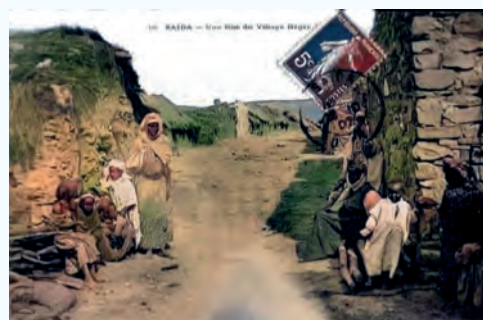
Une rue du village nègre de Saïda

tion noire d'Oran. En effet, à l'époque de l'arrivée des français il y avait dans cette ville une