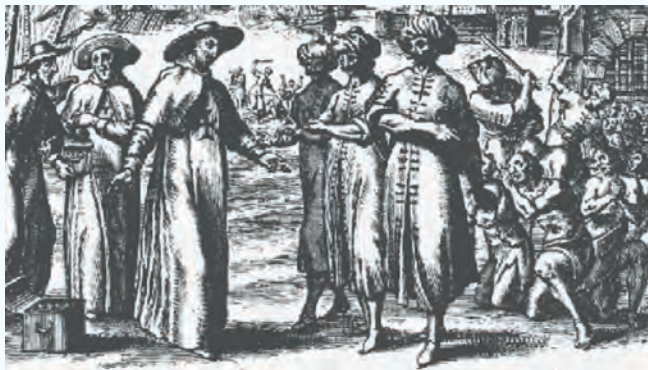
Blancs réduits à l'esclavage

La traite des esclaves majoritairement européens existait déjà, dès le XIIIe siècle, sur les côtes méditerranéennes et elle s'est principalement développée entre les XIVe et XVIIIe siècles. Elle a perduré jusqu'au début du XIXe, alimentant les marchés d'esclaves du littoral de la côte des barbaresque. Le nombre des victimes est impressionnant : selon l'estimation de Robert Davis, les seuls marchands d'esclaves de Tunis, d'Alger et de Tripoli ont réduit 1 million à 1.250.000 de chrétiens européens en esclavage en Afrique du Nord du XVIe au milieu du XVIIIe siècle. Leur capture se faisait lors d'attaques de navires chrétiens en Méditerranée et de razzias dans les pays européens, (y compris l'Angleterre, l'Irlande, les