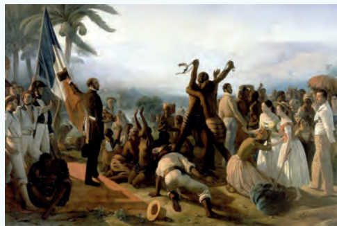
Abolition de l'esclavage en France

Donc l'abolition n'a pas mis fin immédiatement à la traite dans la principale colonie française, car cette mesure posait problème aux autorités françaises : elle produisait un effet sensible sur les populations colonisées car elle portait atteinte aux engagements de respect de leurs lois religieuses. Cependant, l'esclavage a été véritablement aboli