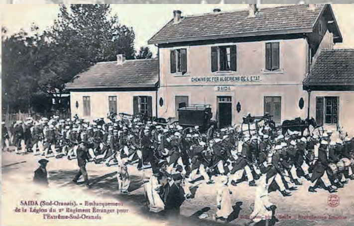
SAÏDA (Sud-Oranais) - Embarquement de la Légion du 2 e Régiment Etranger pour l'Extrême-Sud-Oranais