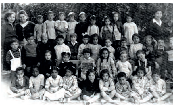
Square Flinois - Année 1950-1951 - École maternelle