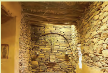
Intérieur de la chapelle

En 1909, il entreprend l'organisation de la confrérie des «frères et sœurs du Sacré-Cœur de Jésus.» En 1911, il construit avec l'aide des soldats un ermitage au sommet de l'Assekrem, haut