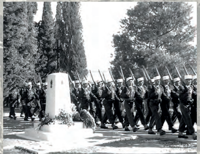
Ain-El-Hadjar : défilé devant le Monument aux morts