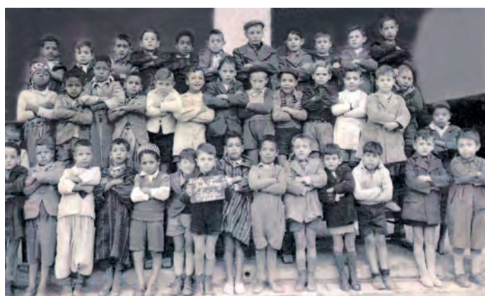
École Jules Ferry - Année 1949 - Classe ?