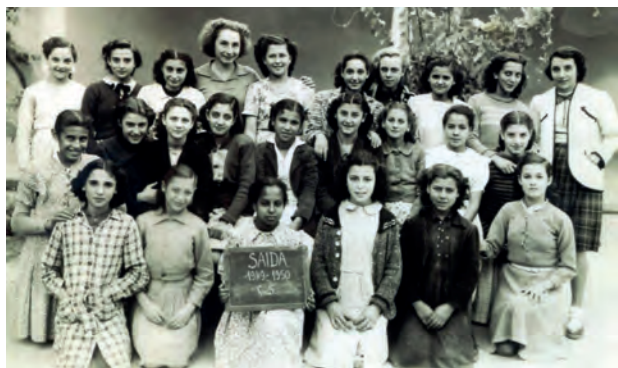
École Jules Ferry - Année 1949-1950 - Cours Supérieur

Le mois de septembre est le mois de la rentrée scolaire. Comme l'année dernière, la rédaction vous propose quelques photos de classe non publiées à ce jour et vous informe des ajouts et/ou modifications à faire dans le Recueil de la Scolarité.