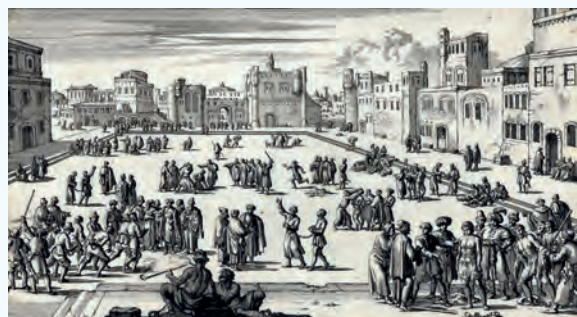
Le marché aux esclaves d'Alger

convertir de force ses habitants à l'Islam. Comme selon les principes coraniques de l'esclavage ne s'appliquent pas entre musulmans, un nombre important de conversions à l'Islam se produisirent dans ces contrées sub-sahariennes.