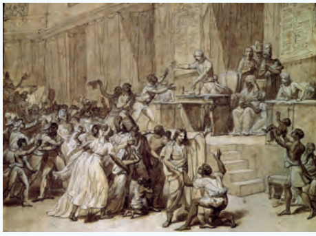
1ère abolition de l'esclavage en 1794

1880, l'administration militaire recensait encore le transit de 2.000 esclaves africains.