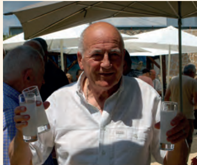
La tournée du Président !