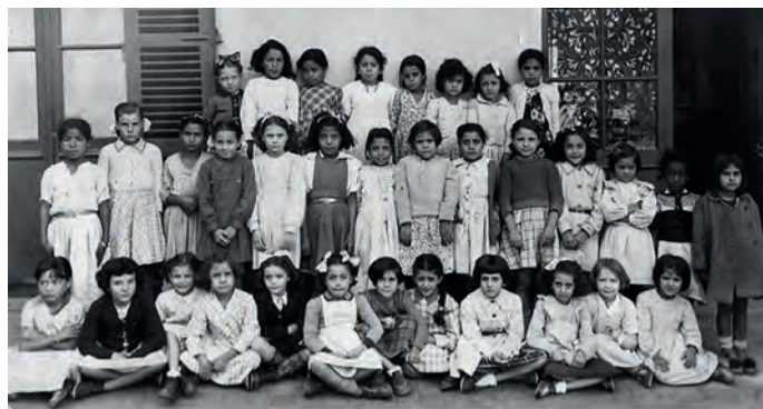
École Jules Ferry - Année ? - Classe ?