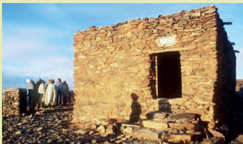
Ermitage de l'Assekrem

férence mais qui ne sera édité que 30 ans après sa mort.