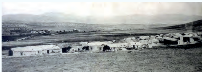
Vue d'ensemble du village nègre de Saïda

A Saïda, où nous avons vécu jusqu'en 1962, existaient des villages étroitement associés à la ville dont celui de Doui-Thabet que nous appelions familièrement village nègre.