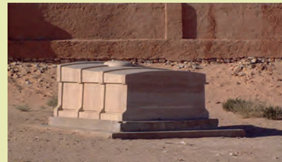
Tombeau El Méniaa

Il est très vite considéré comme un martyr. Charles de Foucauld repose depuis le 26 avril 1929 dans un tombeau à El-Goléa, appelé aujourd'hui El Méniaa.